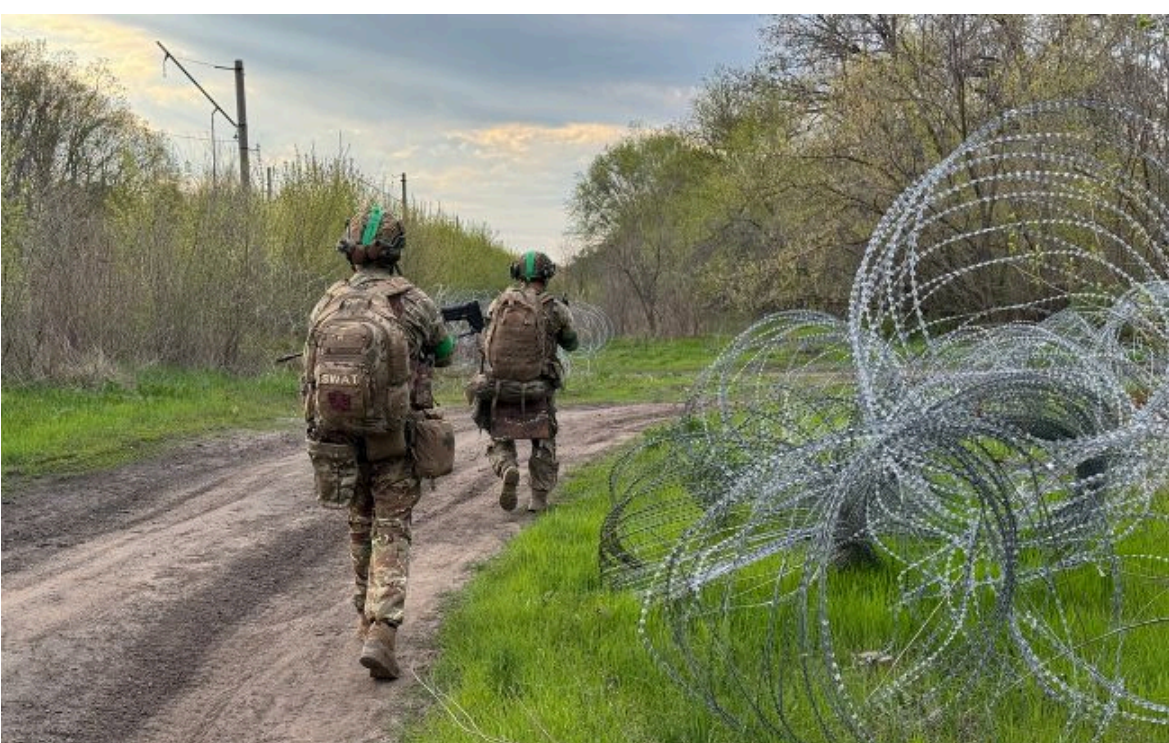
Фото: українські військові (Getty Images)