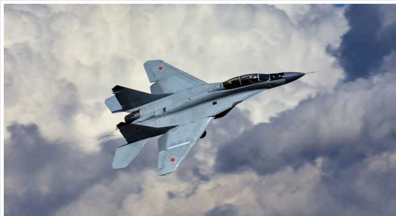
Цього року військові літаки РФ 109 разів наближались до кордону Латвії

Цього року над Балтійським морем біля зовнішнього кордону територіальних вод Латвії зафіксовано 109 випадків появи російських військових літаків.