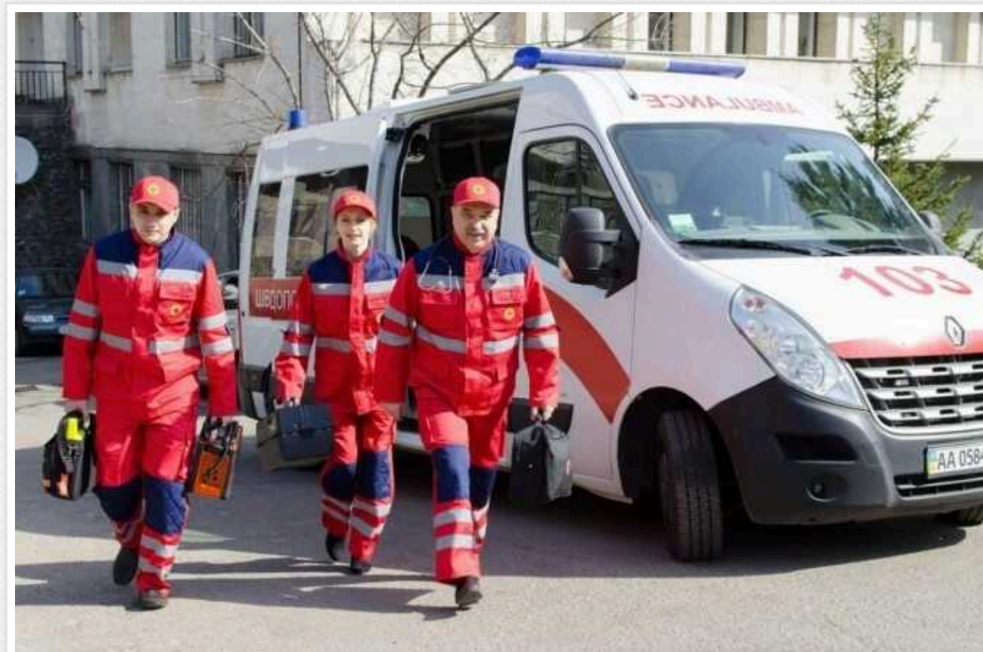
Окупанти двічі за ніч атакували селище на Харківщині: серед 6 постраждалих – вагітна

Вночі російські війська здійснили два удари по селищу Слатине на Харківщині, внаслідок чого постраждали 6 осіб, серед яких – вагітна жінка.