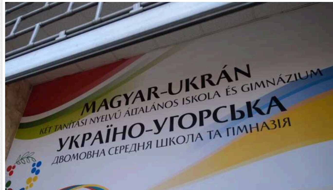
В Угорщині запрацювала перша державна двомовна школа для українських дітей

В Угорщині відкрилася перша державна українсько-угорська двомовна школа для дітей з України. Вона функціонує у Будапешті.