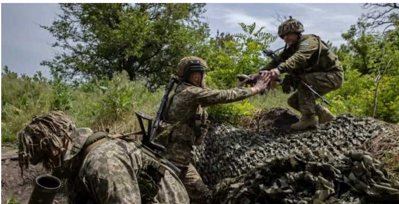
У 3-й ОШБр показали унікальні кадри контратаки на Харківщині

У бригаді повідомили, що ворожі сили мали перевагу в чисельності у 2,5 рази. Незважаючи на це, ворог втратив сотні своїх бійців.