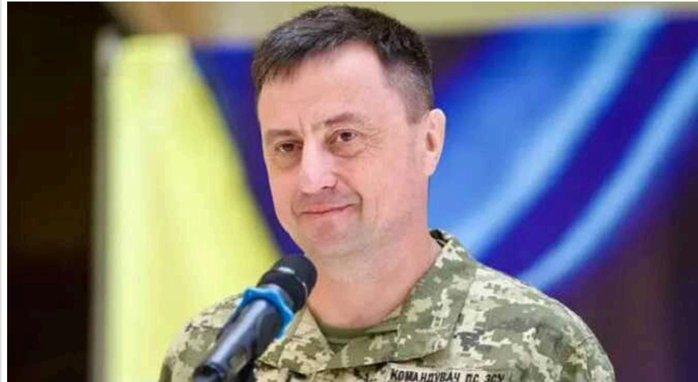
Микола Олещук підбив підсумки перебування на посаді командувача ПС ЗСУ

Колишній командувач Повітряних сил ЗСУ Микола Олещук підсумував свою діяльність на цій посаді, яку він обіймав трохи більше трьох років. За словами генерал-лейтенанта, ці роки були важкими, адже вони пройшли у війні за Україну, і щодня йі значні йому довелося приймати непрості рішення, від яких прямо залежали життя багатьох людей, контроль повітряного простору та ситуація на фронті.