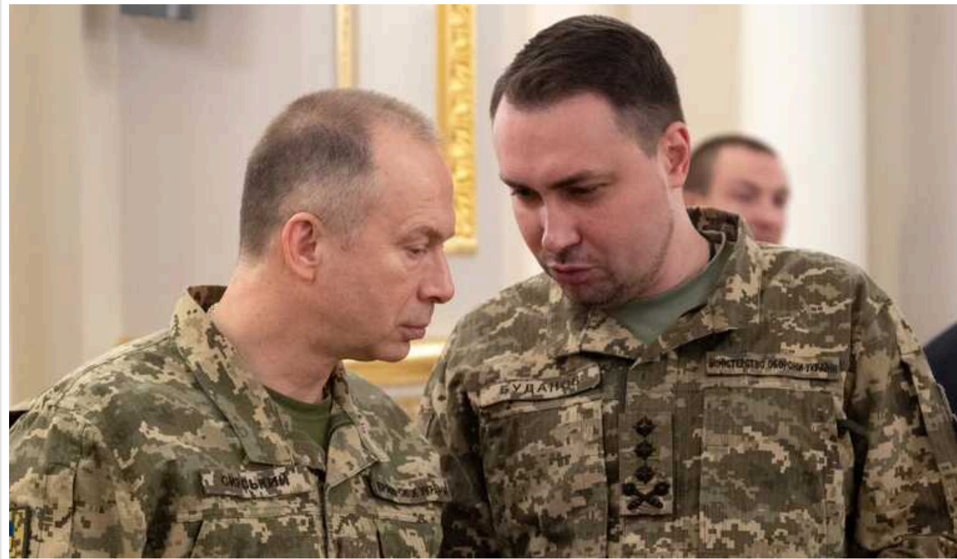
Сирський не допустив ГУР МО до операції в Курській області, – le Monde

Генеральний штаб Збройних сил України не дозволить російським повстанцям, які беруть участь у бойових діях проти армії Путіна, здійснити найзухвалішу військову операцію Києва за останні два з половиною роки – наступ у Курській області.