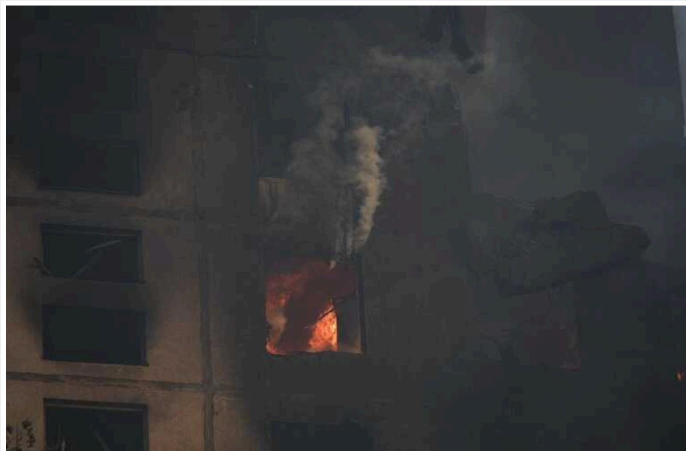
Удар по Харкову: кількість постраждалих зросла до 47

Про це повідомив очільник Харківської обласної військової адміністрації Олег Синегубов.