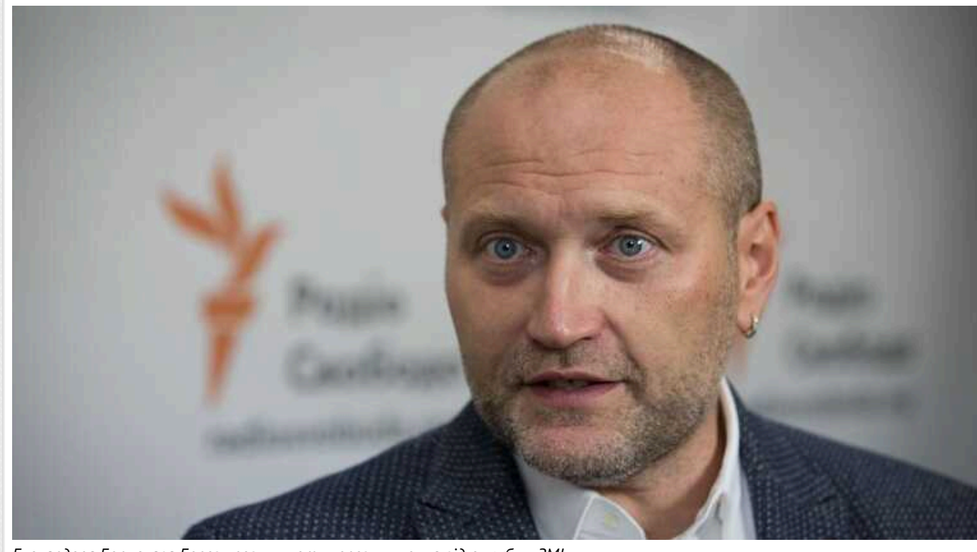
Екснардепа Борислава Березу розшукують через ухилення від служби, - ЗМІ

Національна поліція отримала документи для розшуку колишнього народного депутата Борислава Берези за його ухилення від служби. Відомо, що в березні цього року він покинув Україну.