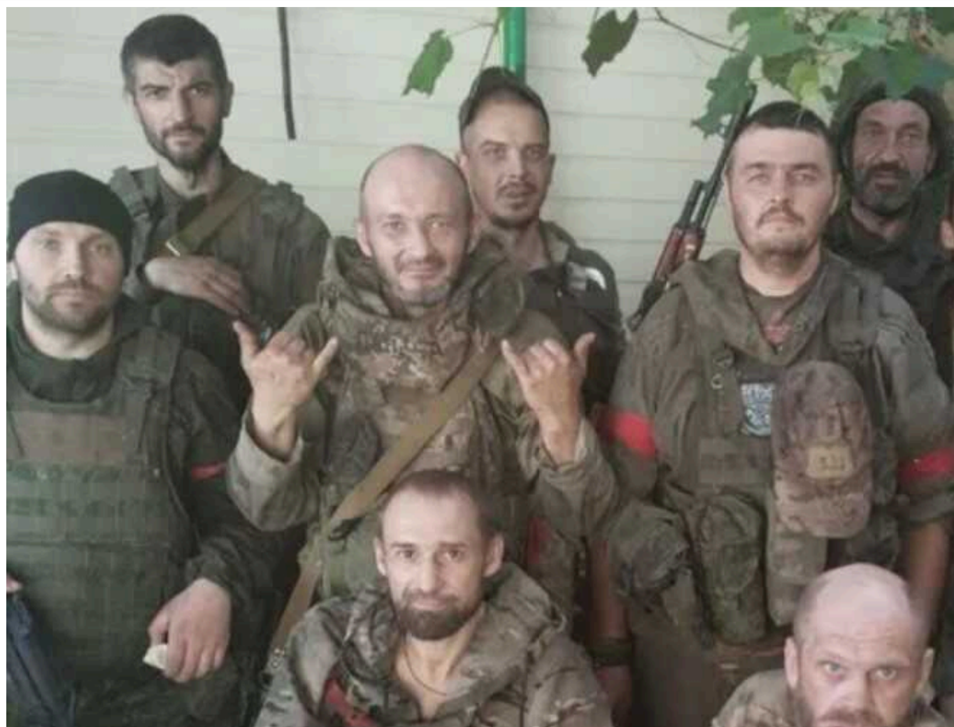
На Курщині розпочали формування «загонів добровольців» у відповідь на операцію ЗСУ

Російська адміністрація створює нові "добровольчі загони" територіальної оборони в спробі відповісти на український наступ в Курській області. Вона вирішила набрати близько 1600 новобранців на шестимісячні контракти, яких обіцяють навчити воювати разом із регулярними військами.