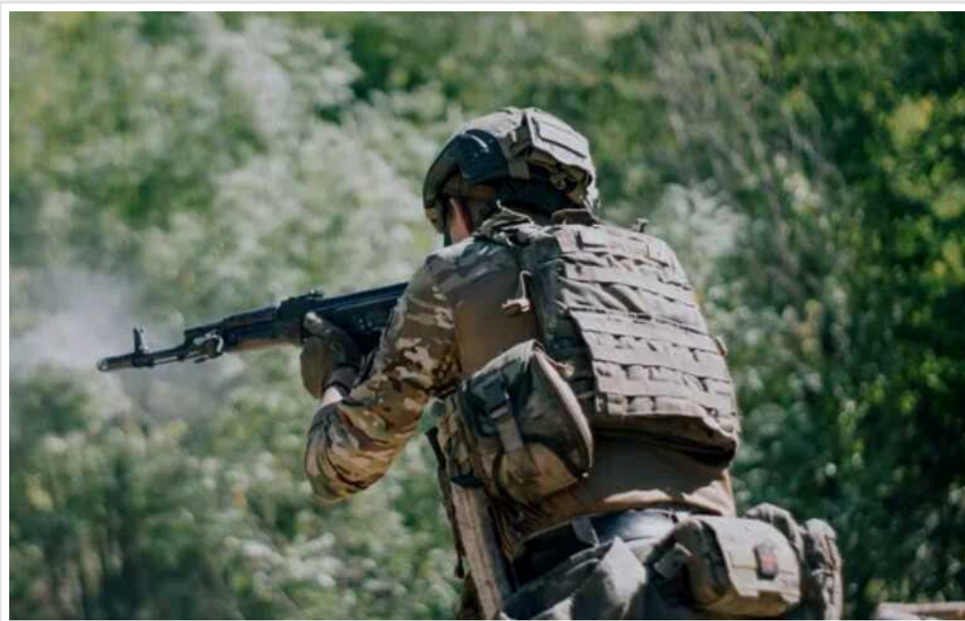
Українські бійці знищили штурмову групу окупантів на Торецькому напрямку і захопили полонених

На Торецькому напрямку фронту в Донецькій області українські захисники знищили ще одну штурмову групу військ РФ. Декілька окупантів були захоплені в полон.