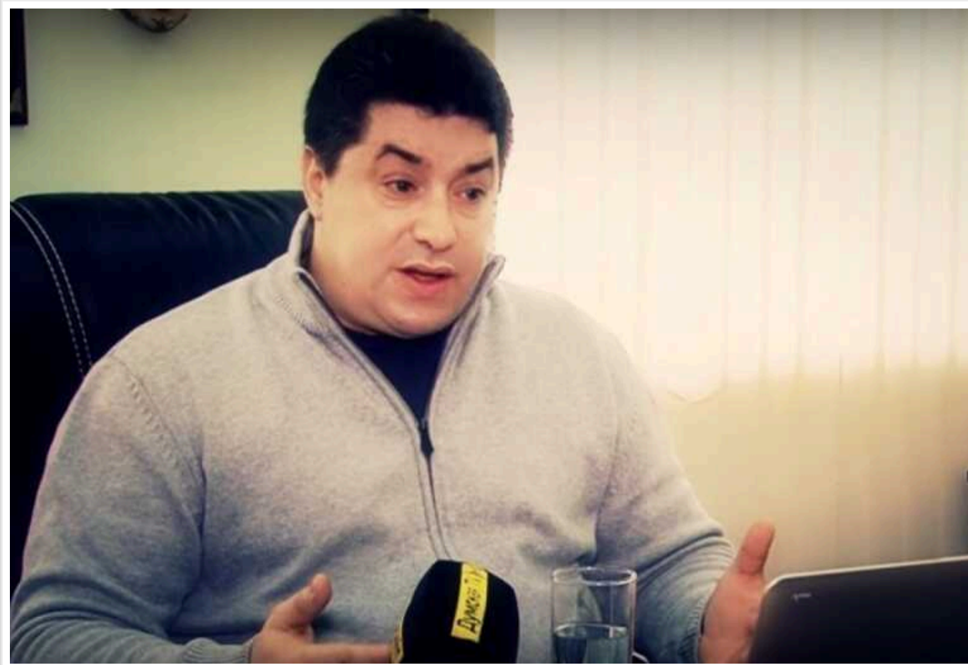
Секта Мальцева: Керівників одеського культу запідозрили у держзраді та підготовці диверсій

Фігурантами справи про державну зраду та інші злочини виявилися представники відомої деструктивної організації, а точніше цілого деструктивного холдингу, який очолює скандальний Олег Мальцев.