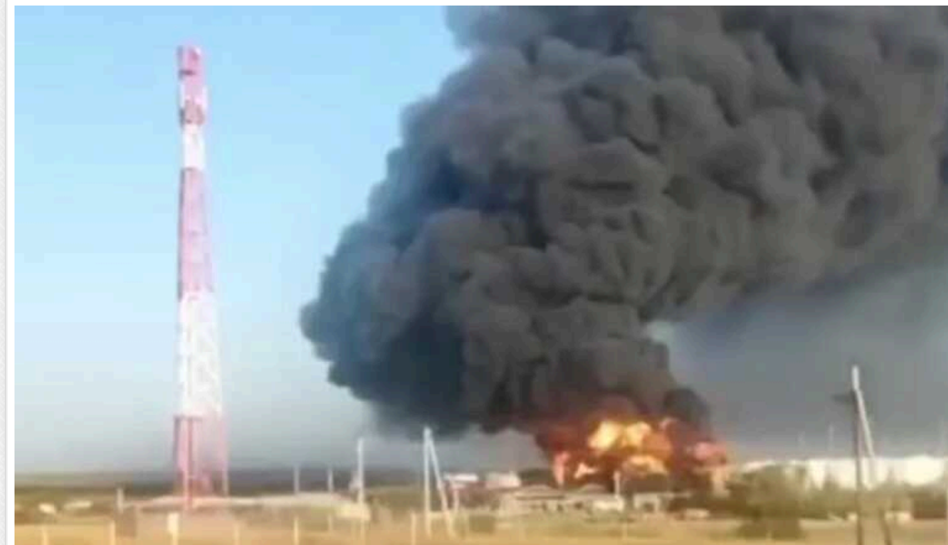
У Ростовській області РФ вже кілька днів горить нафтобаза «Атлас»

Неподалік міста Камєньск-Шахтинський в Ростовській області Росії станом на ранок 30 серпня продовжує палати нафтобаза "Атлас". Удару по ній безпілотники завдали в ніч на 28 серпня.