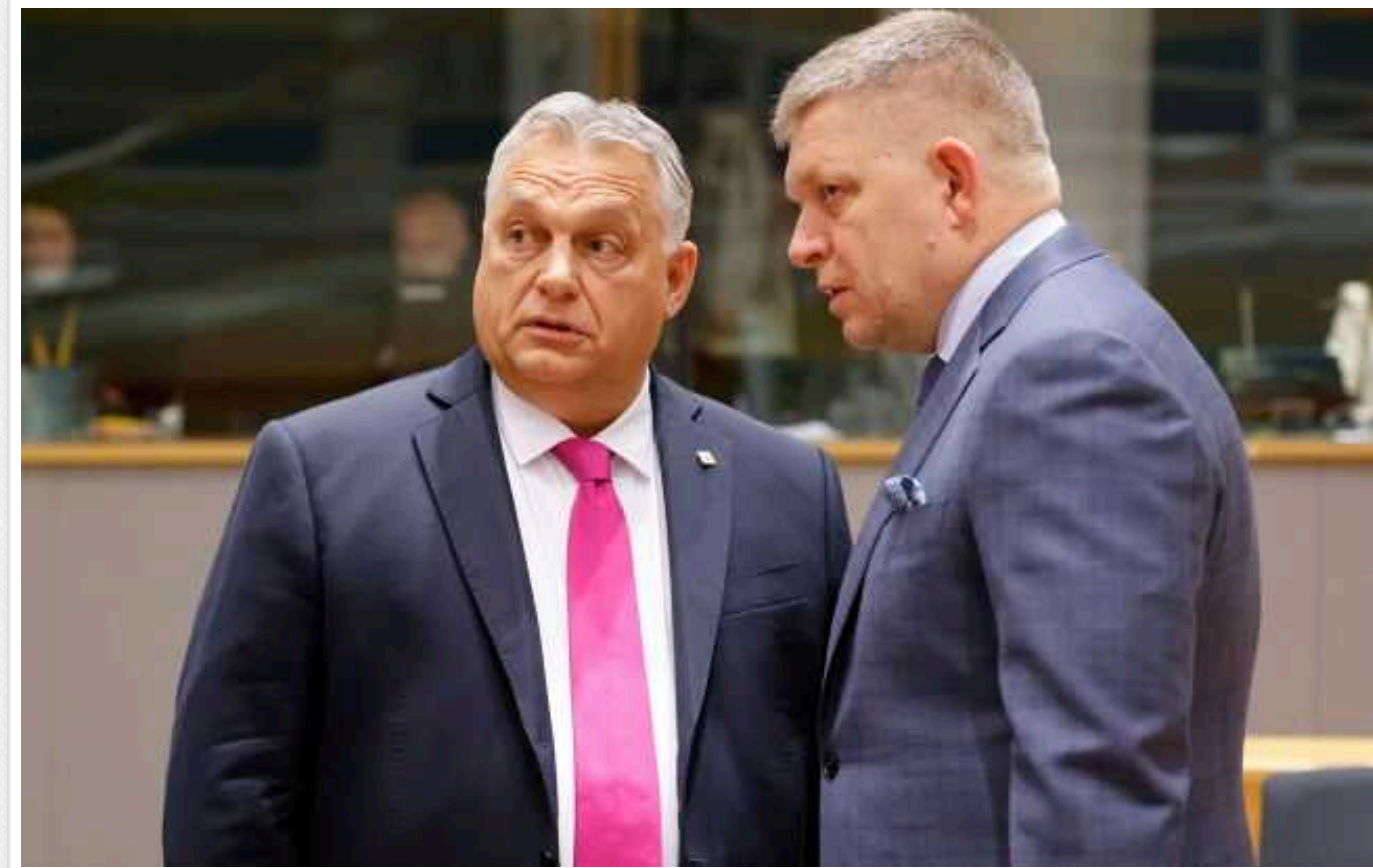
Politico: Угорщина та Словаччина відмовилися схвалити удари України по Росії західною зброєю

Словаччина разом з Угорщиною відмовились підтримати удари України по Росії з використанням західної зброї, наданої Києву. В обох країнах діють дружні Москві режими.