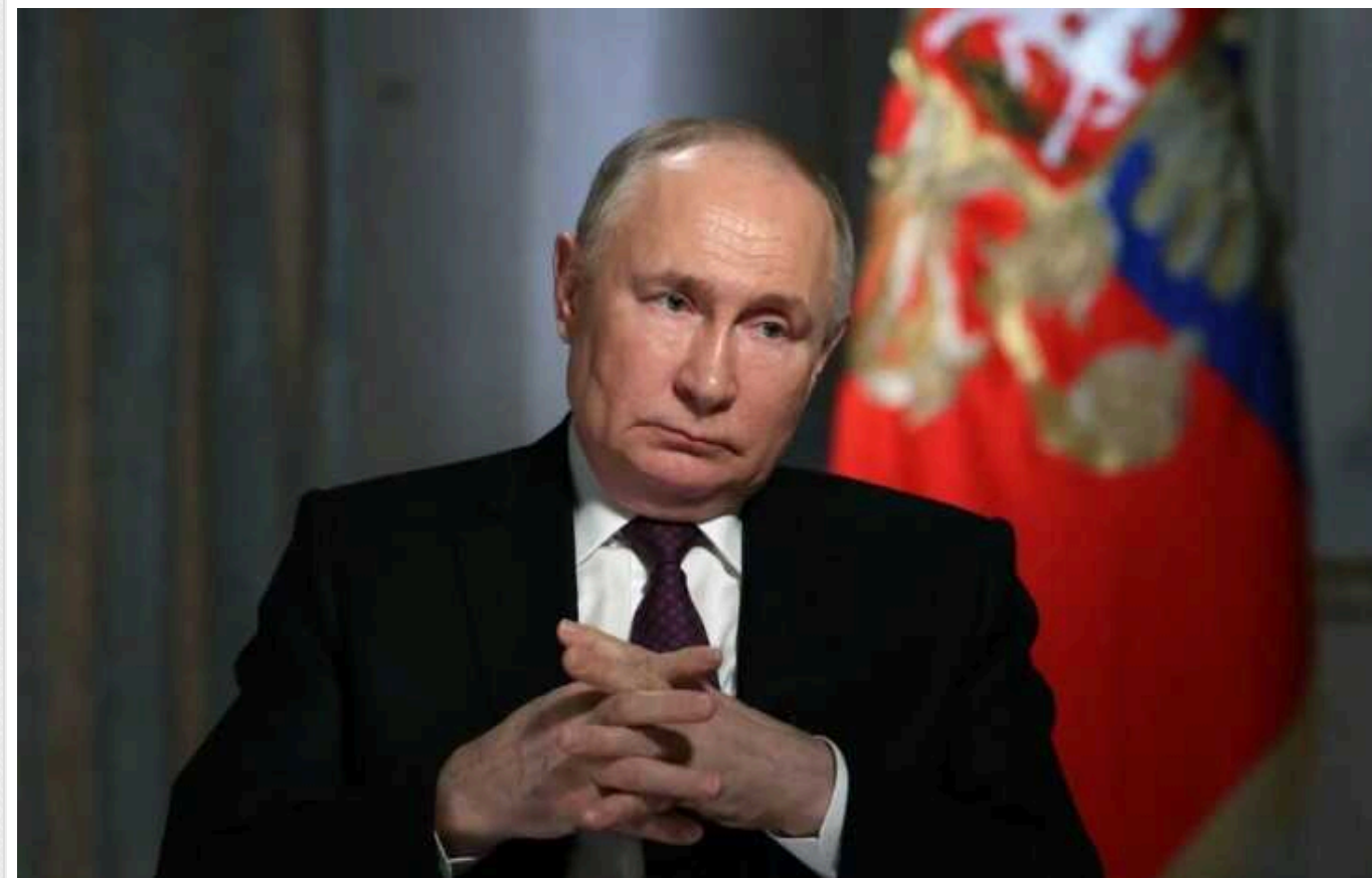
Путін вперше відвідає країну, яка має заарештувати його за ордером МКС

Російський диктатор Володимир Путін 3 вересня збирається з офіційним візитом до Монголії на запрошення президента Ухнаагійна Хурелсуха.