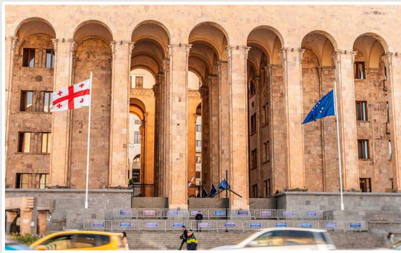
Євросоюз вкрай стурбований ситуацією у Грузії

Головний дипломат ЄС Жозеп Боррель повідомив, що держави-члени Євросоюзу висловлюють значну стурбованість курсом, який обирає грузинська влада, і це призводить до віддалення країни від членства в ЄС.