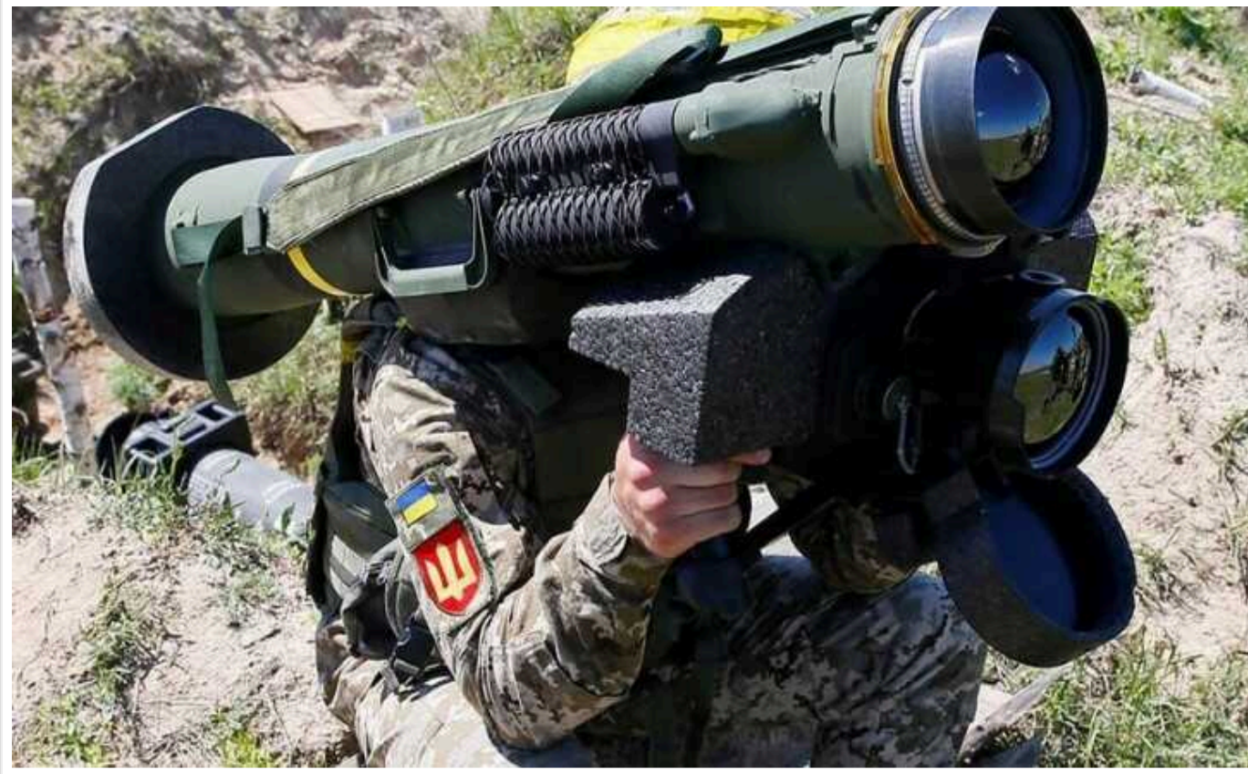
Сполучені Штати замовили ракети Javelin на 1,3 мільярда доларів: частину отримає Україна

Армія США замовила ракети Javelin на суму на суму 1,3 мільярда доларів, що є найбільшим однорічним контрактом на виробництво Javelin. Частину з отриманих ракет планують передати Україні.