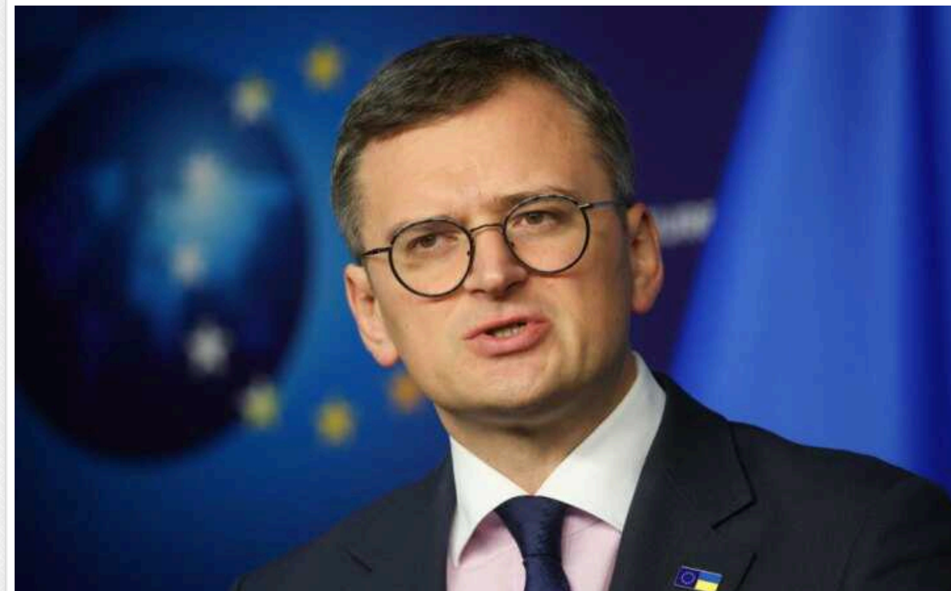
Частина польських політиків розкритикували Кулебу за його заяви щодо операції «Вісла»

Політики з колишньої правлячої партії "Право і справедливість" у Польщі відреагували низкою образливих коментарів на заяви голови МЗС України Дмитра Кулеби про ексгумацію та операцію "Вісла" під час панельної дискусії.