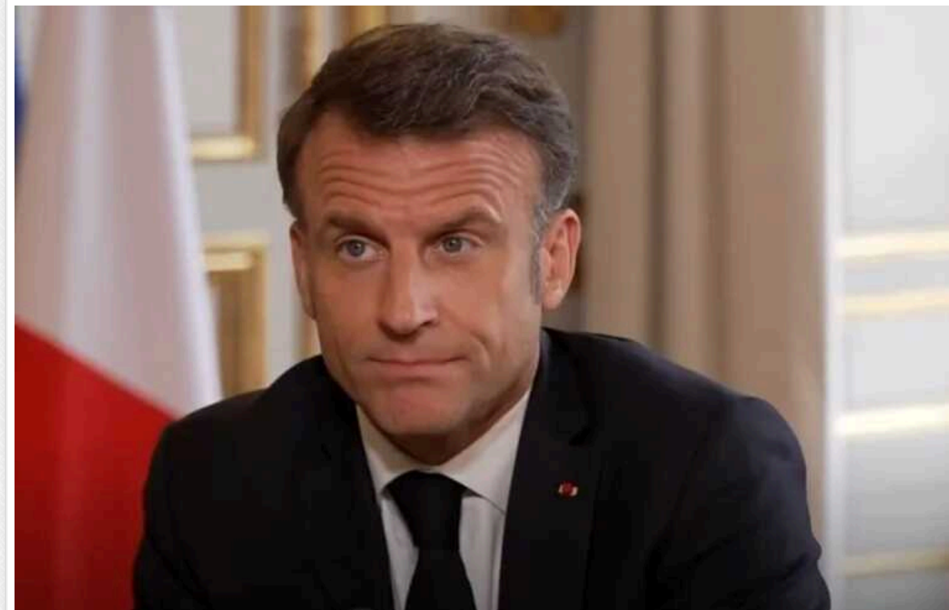
Макрон заявив, що «повністю бере на себе відповідальність» за надання громадянства засновнику Telegram Дурову

Виступ політика у Белграді (Сербія) транлював телеканал BFM TV. Макрон також повідомив журналістам, що не планував зустріч із Павлом Дуровим під час візиту засновника Telegram до Парижа.