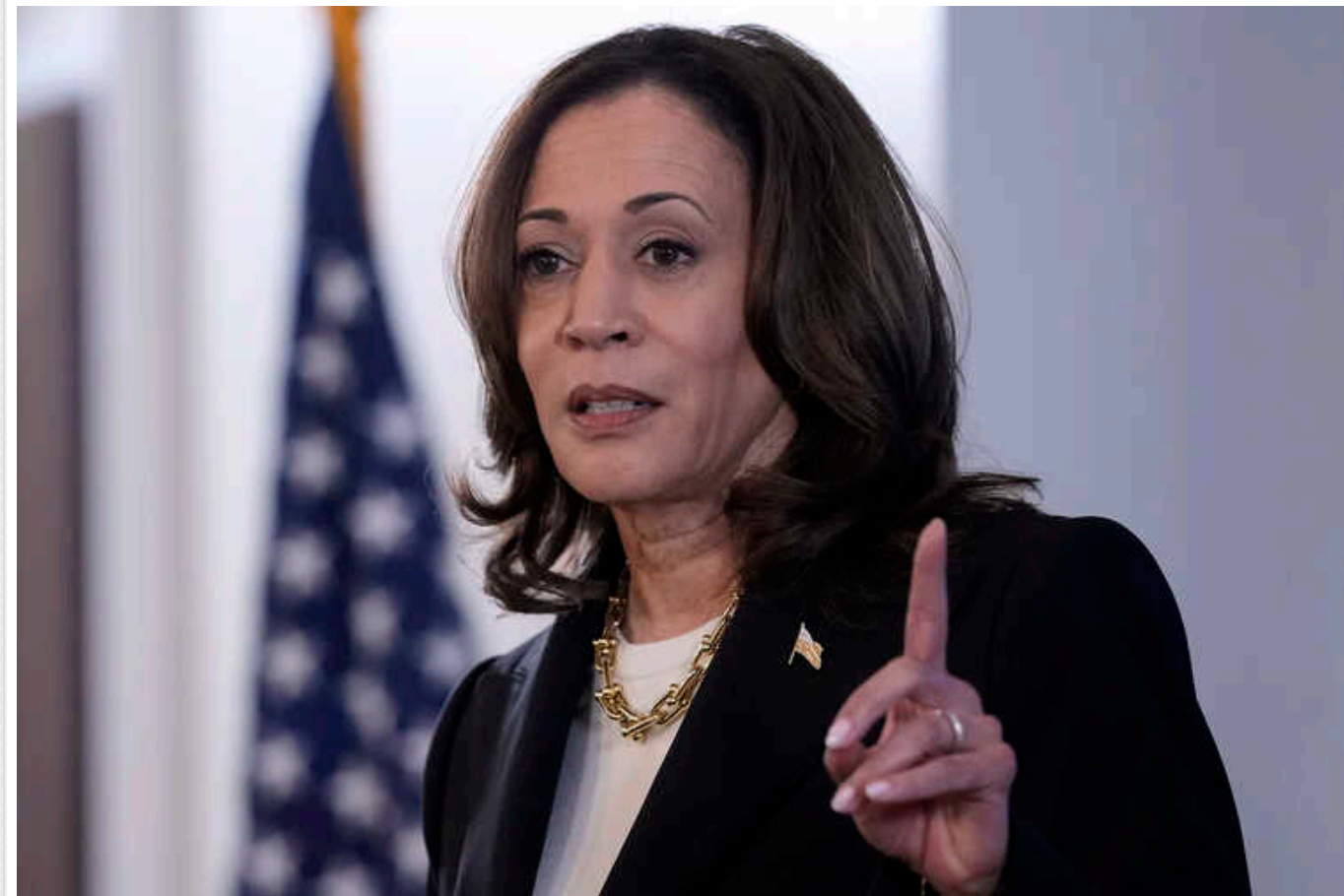
Гарріс збільшує відрив від Трампа, – опитування

Кандидатка в президенти США від демократів Камала Гарріс має перевагу над своїм опонентом-республіканцем Дональдом Трампом з результатом 45% проти 41%.