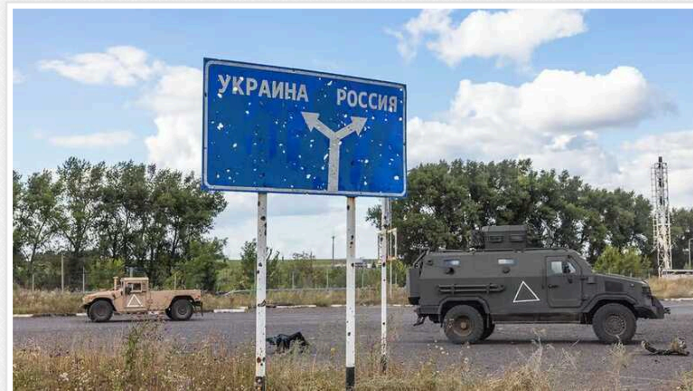
Курський наступ був важливий вже сам по собі, а не лише з точки зору зайнятої території, – МЗС Швеції

Рішучий наступ України на території РФ підірвав режим Путіна і спростував його хибні попередження про те, що посилення підтримки Києва з боку Заходу призведе до ескалації війни.