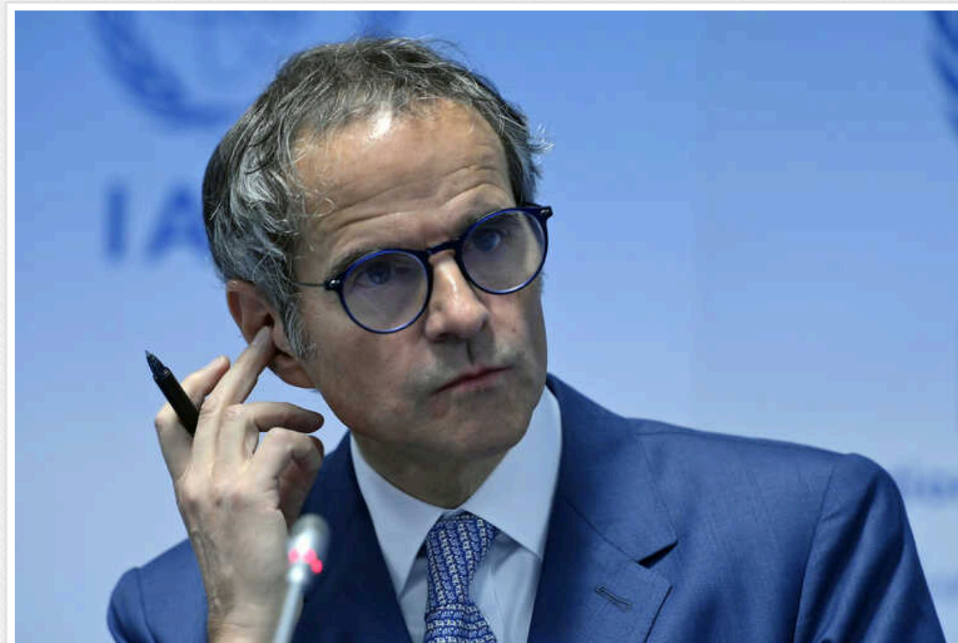
Голова МАГАТЕ Гроссі наступного тижня відвідає Київ і ЗАЕС

Генеральний директор Міжнародного агентства з атомної енергії (МАГАТЕ) Рафаель Гроссі наступного тижня відвідає Київ і Запорізьку атомну електростанцію.