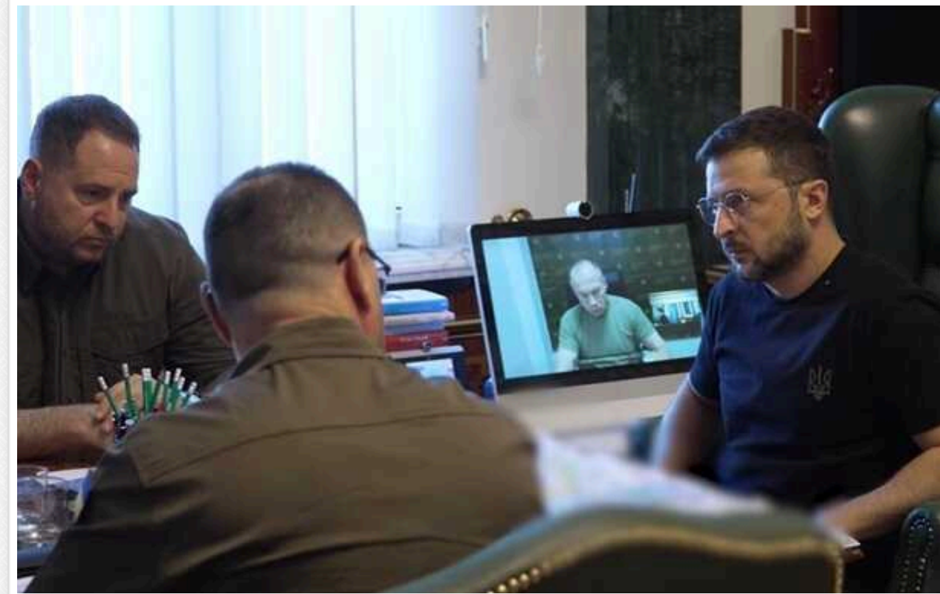
Зеленський провів наради з військовим керівництвом щодо ситуації на фронті та розробки далекобійної зброї