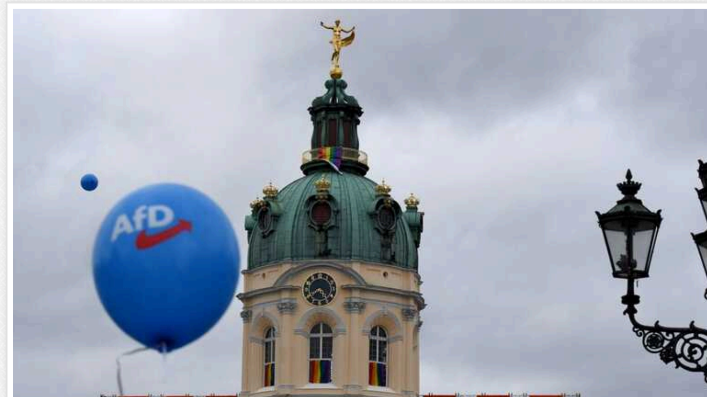
BILD: Місцеві вибори у ФРН можуть назавжди змінити Німеччину

Цієї неділі відбудуться вибори до ландтагів двох федеральних земель на сході Німеччини: Саксонії та Тюрингії.