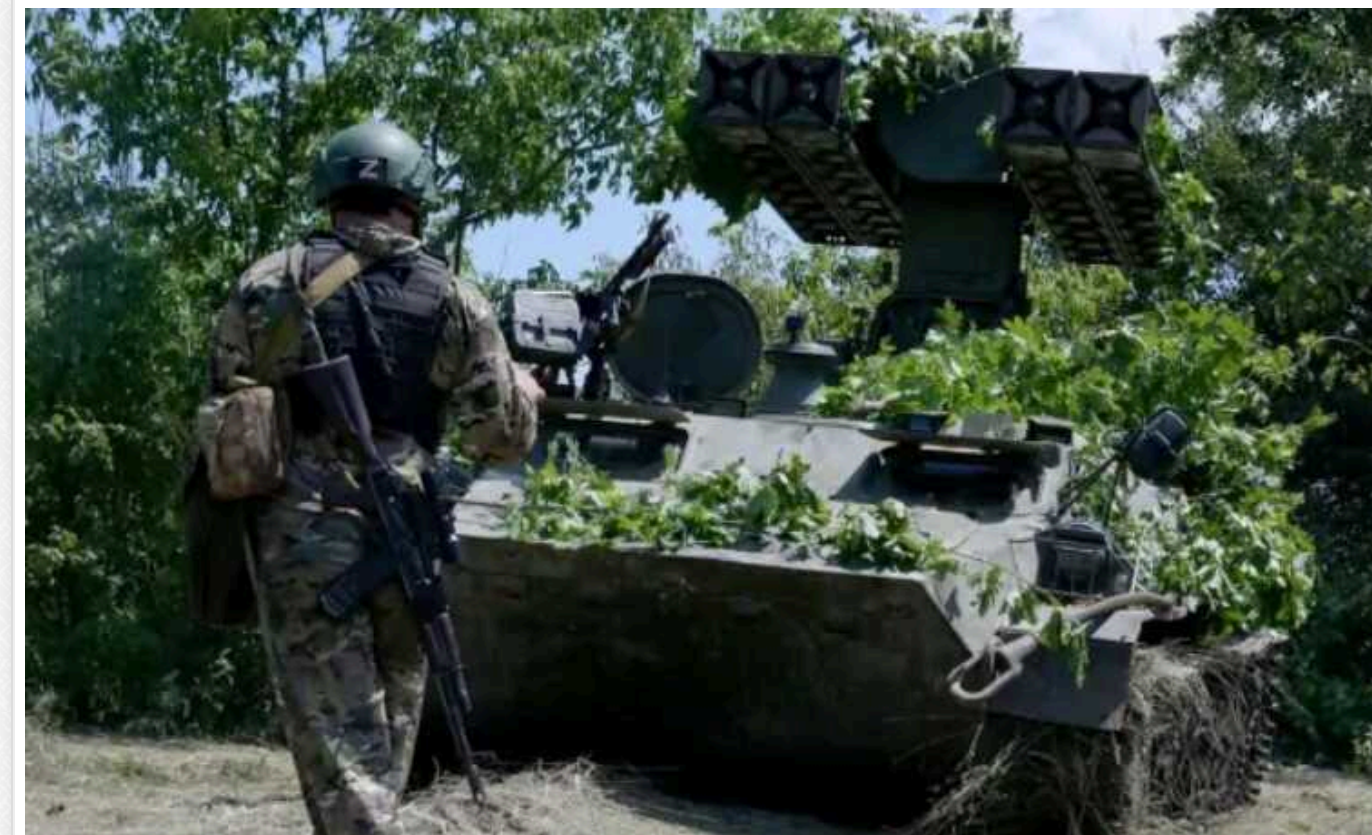
ЗС РФ намагалися здійснити прорив у центральну частину Вовчанська, — ЗСУ