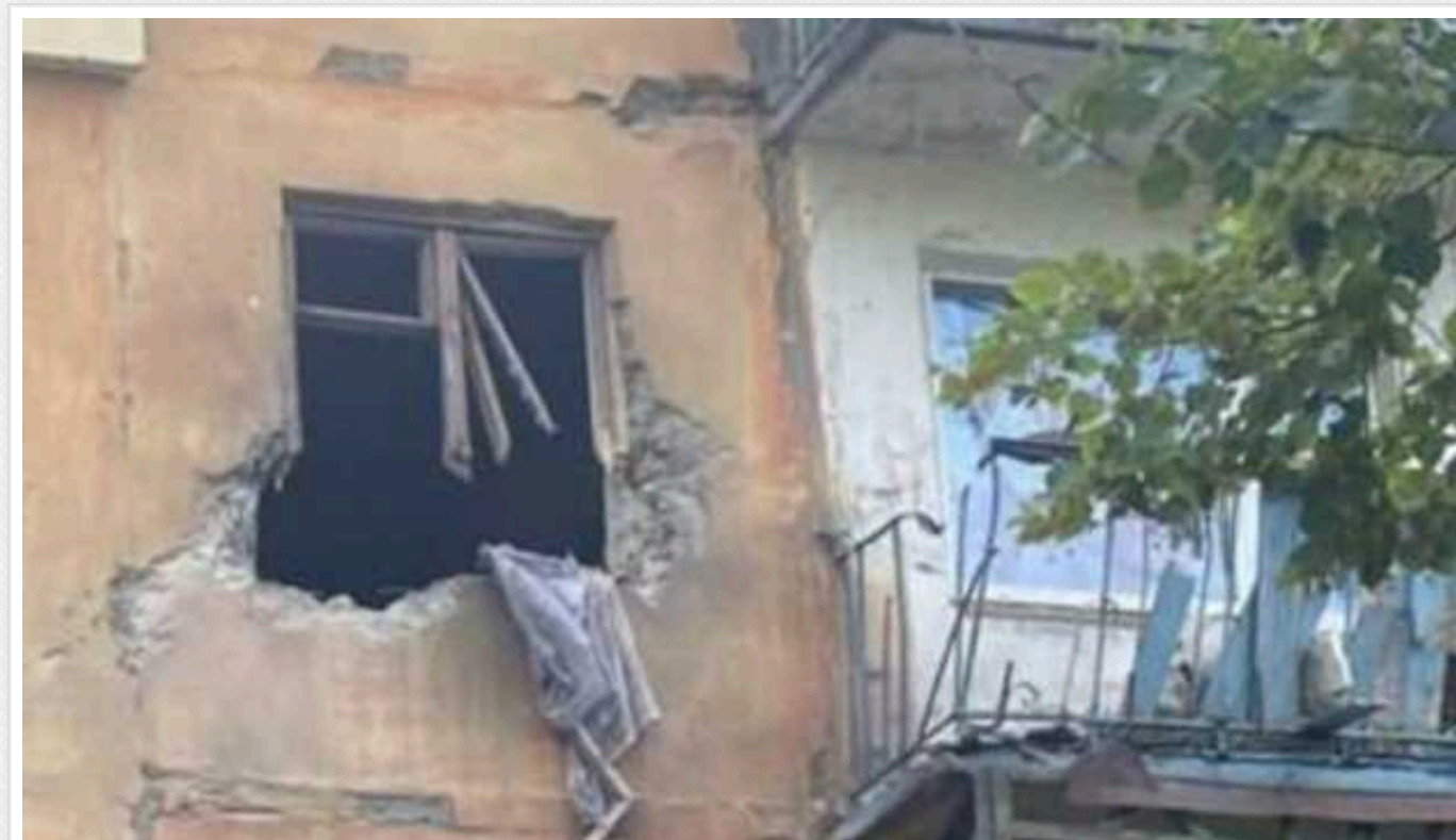
Окупанти здійснили обстріл Українська та Костянтинівки: поранено шість цивільних осіб

На Донеччині російські загарбники обстріляли Українськ та Костянтинівку, внаслідок чого поранення отримали шестеро цивільних.