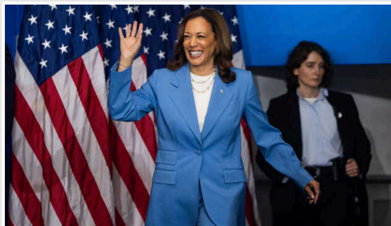
Після з'їзду Демпартії Гарріс випереджає Трампа на 5%

Кандидатка в президенти США від демократів Камала Гарріс після партійного з'їзду в Чикаго має перевагу над своїм суперником - республіканцем Дональдом Трампом - у 5%.