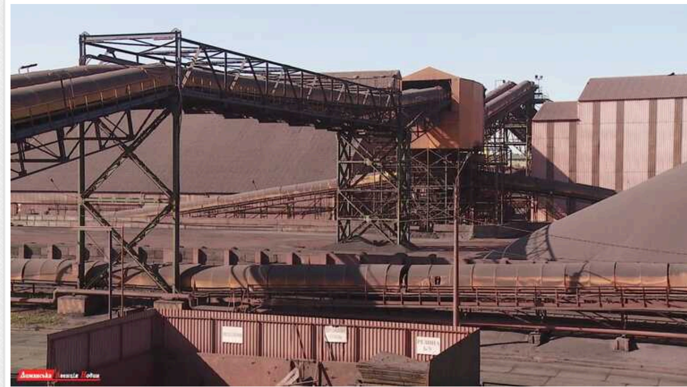
ВАКС ухвалив рішення не передавати арештовані кошти «ТІС» до АРМА або ГУР МО

НАБУ та Головному управлінню розвідки Міноборони не вдалося отримати арештовані кошти компаній «ДП ВОРЛД ТІС ПІВДЕННИЙ» і ТОВ «ТІС-Руда», які пов'язані з російським олігархом Олексієм Федоричевим та українськими бізнесменами Андрієм Ставніцером, Єгором Гребенніковим та Олегом Кутателадзе.