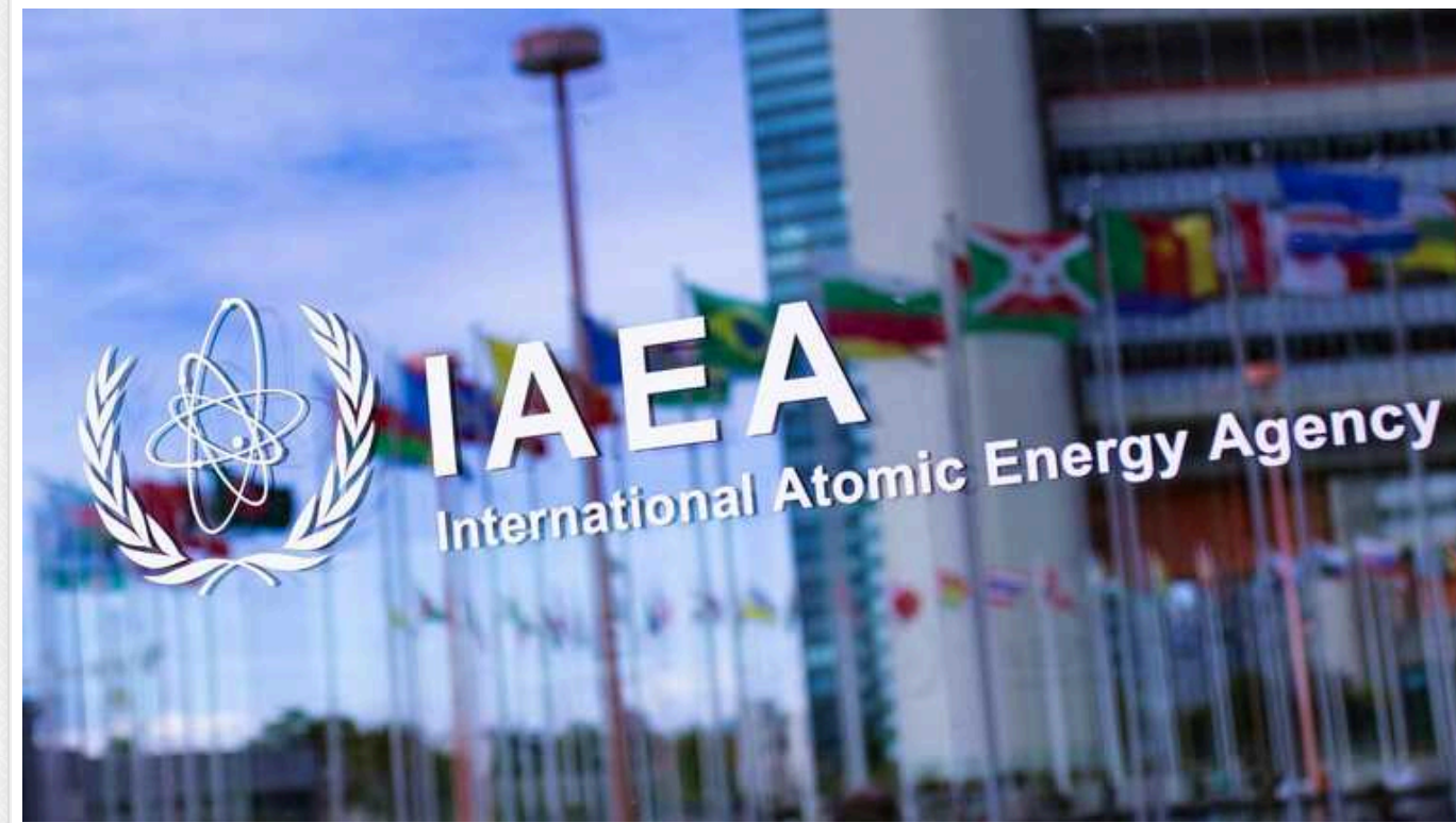
Росія атакою 26 серпня хотіла порушити роботу українських АЕС, - звернення України до МАГАТЕ

Масовий ракетно-дроновий напад Росії на критично важливу інфраструктуру української енергосистеми 26 серпня мав на меті порушити роботу атомних електростанцій (АЕС) країни, йдеться в офіційній ноті України до МАГАТЕ.