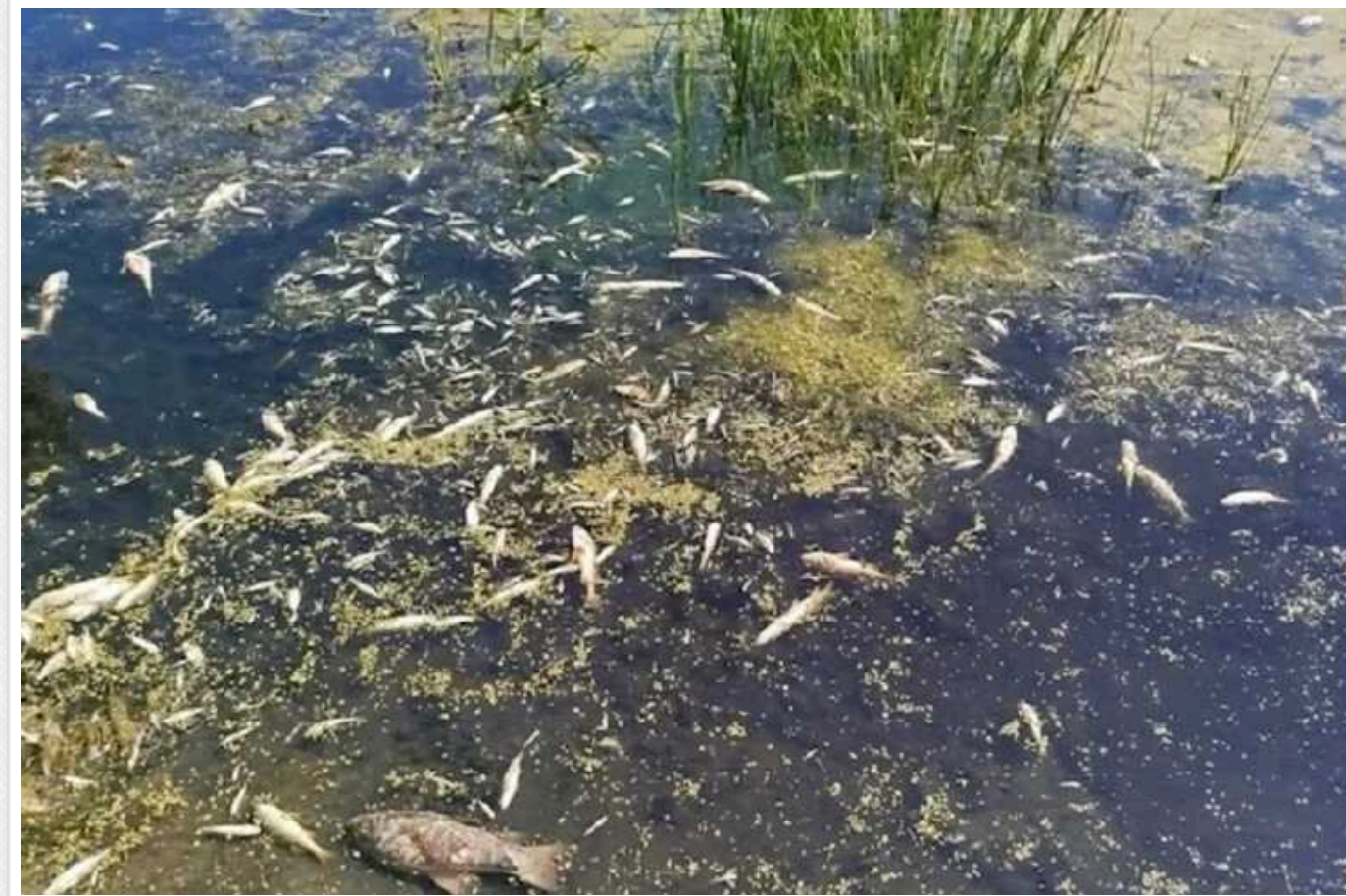
Держрибагентство: Росіяни отруїли річку Сейм, що впадає в Десну

У річці Сейм зафіксовано перевищення гранично допустимих концентрацій забруднювальних речовин через скидання російськими військами невідомих відходів. Забруднення охопило всю акваторію річки в Сумській області та дійшло до Чернігівщини.