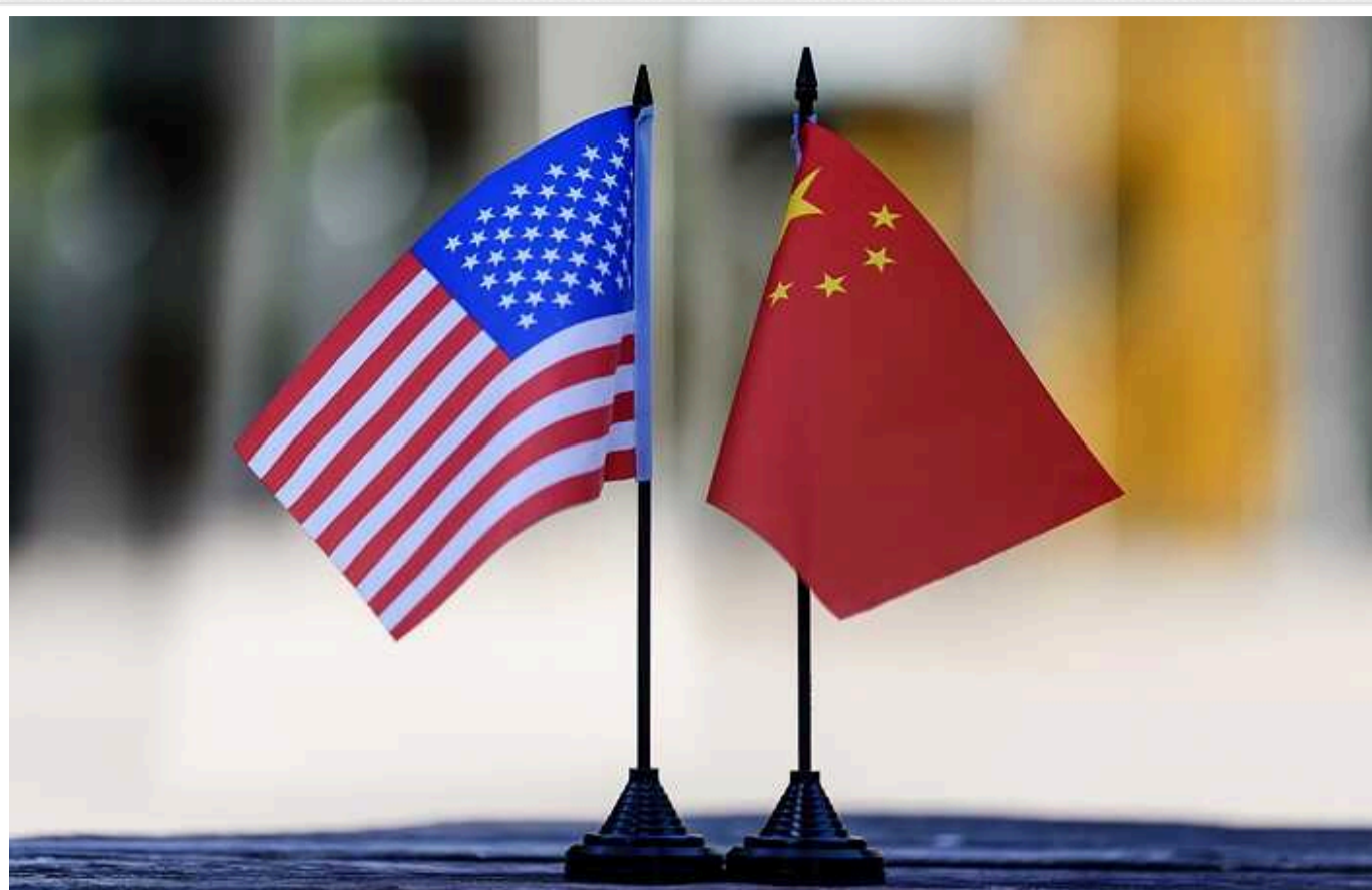
Салліван зустрівся з Сі Цзіньпіном: США та Китай прагнуть зміцнити свої зв'язки, в обговоренні війни в Україні не досягли прогресу

Обидві країни прагнуть зміцнити свої зв'язки перед виборами в США.