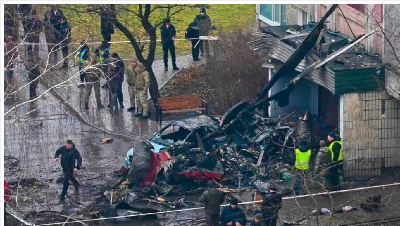
Авіакатастрофа з керівництвом МВС у Броварах: судитимуть п'ятьох посадовців ДСНС

У Києві розпочинуть судовий процес над п'ятьма посадовцями ДСНС у справі про авіакатастрофу в Броварах, внаслідок якої загинуло керівництво МВС. Трагедія сталася 18 січня 2023 року.