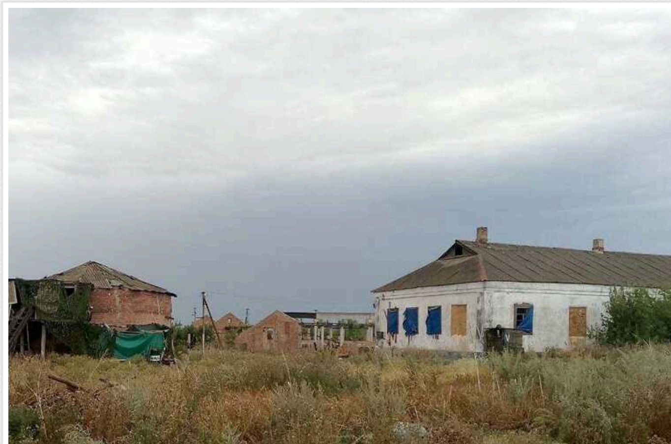
Агент "Атеш" розвідав базу окупантів на Запоріжжі

Російські окупанти продовжують використовувати будинки цивільних осіб як укриття на тимчасово захоплених територіях. В одному з населених пунктів Запорізької області була виявлена база загарбників у житловому будинку.