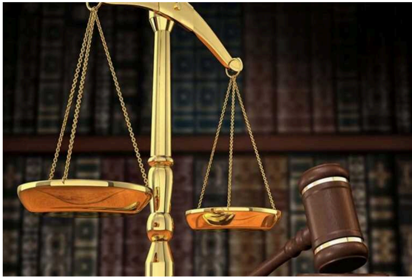
На Волині суд вирішив, що проходження військовозобов'язаним ВЛК недоцільне в разі наявності права на відстрочку

Суд зазначив, що ТЦК, як суб'єкт владних повноважень, який відповідає за вирішення питання про надання відстрочки, після отримання від позивача заяви та документів, що підтверджують наявність підстав для надання відстрочки, має розглянути це питання без попереднього проходження військово-лікарської комісії та уточнення військово-облікових даних.