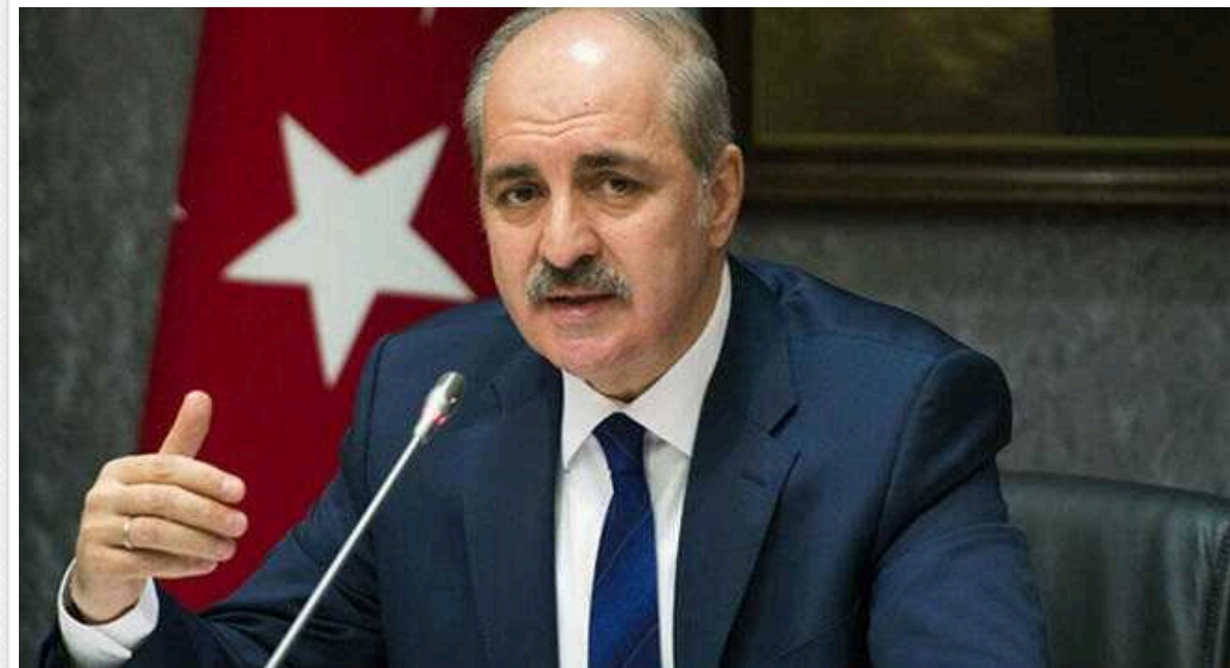
Соратник Ердогана звинуватив "деякі країни" в зриві мирних переговорів між Україною та РФ

За словами спікера парламенту Туреччини Нумана Куртулмуша, США, ймовірно, намагаються втягнути Росію у серйозні проблеми та вважають "регіональну турбулентність важливою для балансу сил у цьому регіоні".