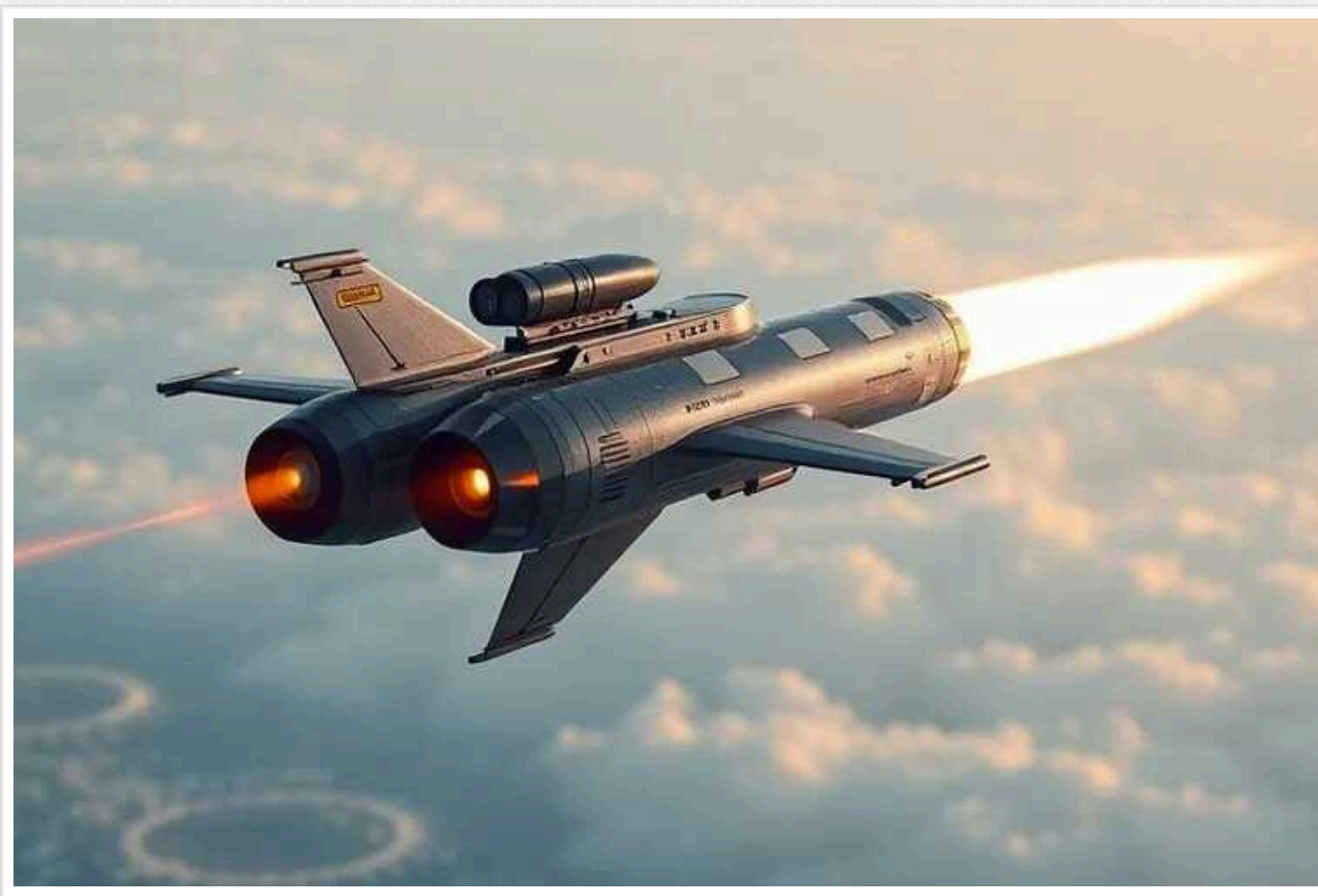
Forbes: Таємнича українська ракета-дрон «Паляниця» націлена на авіацію РФ

“Паляниця” зможе уражати цілі на території Росії без обмежень та без дозволу. Проте, її ефективність буде залежати від того, чи вдасться випустити її в кількості, достатній для проведення масованих атак на всі російські авіабази, які знаходяться в межах досяжності.