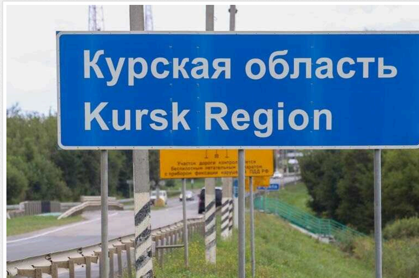
ЦРУ: Путін планує контрнаступ на Курську область

Заступник ЦРУ Девід Коен зазначив, що Путіну доведеться визнати існування лінії фронту на його території та зіткнутись з громадською думкою щодо втрати частини території.