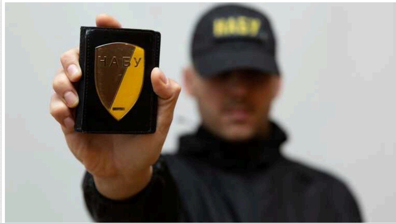
Реставрація за завищеними цінами: в Одесі проходять обшуки у справі про розкрадання бюджетних коштів