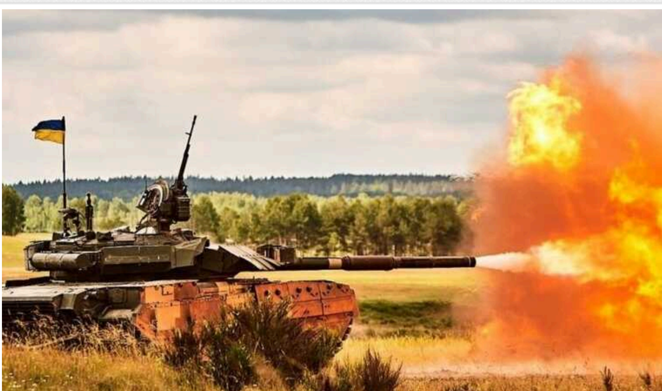
Forbes: Якщо операція ЗСУ в Курській області була відволікаючим маневром, то вона провалилася

"Якщо дії України в Курській області Росії були відволікаючим маневром, то вони не досягли своєї мети", – стверджує Forbes у заголовку.