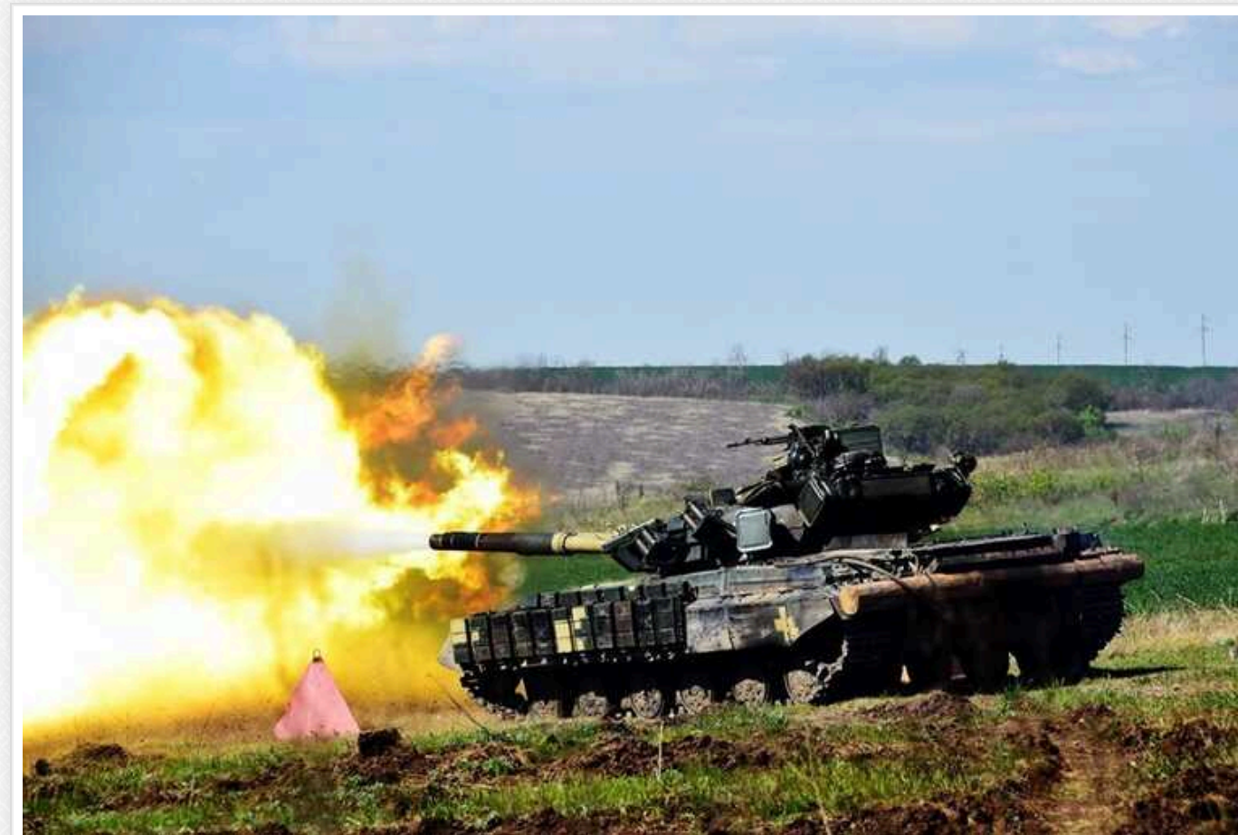
ISW: ЗСУ сповільнили просування в Курській області та стабілізують ситуацію

Просування ЗСУ в Курській області сповільнилося. Військові намагаються закріпитися та утримати окремі райони, які нещодавно були взяті під контроль.