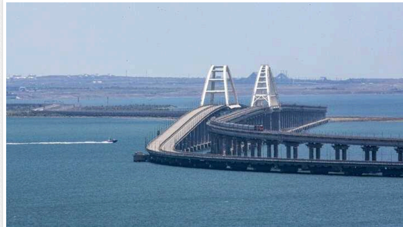
В окупованому Севастополі скаржаться на атаку дронів: Кримський міст перекрито

Тимчасово окупований Севастополь у Криму зазнає атаки ударних безпілотників. Рух Кримським мостом призупинено.