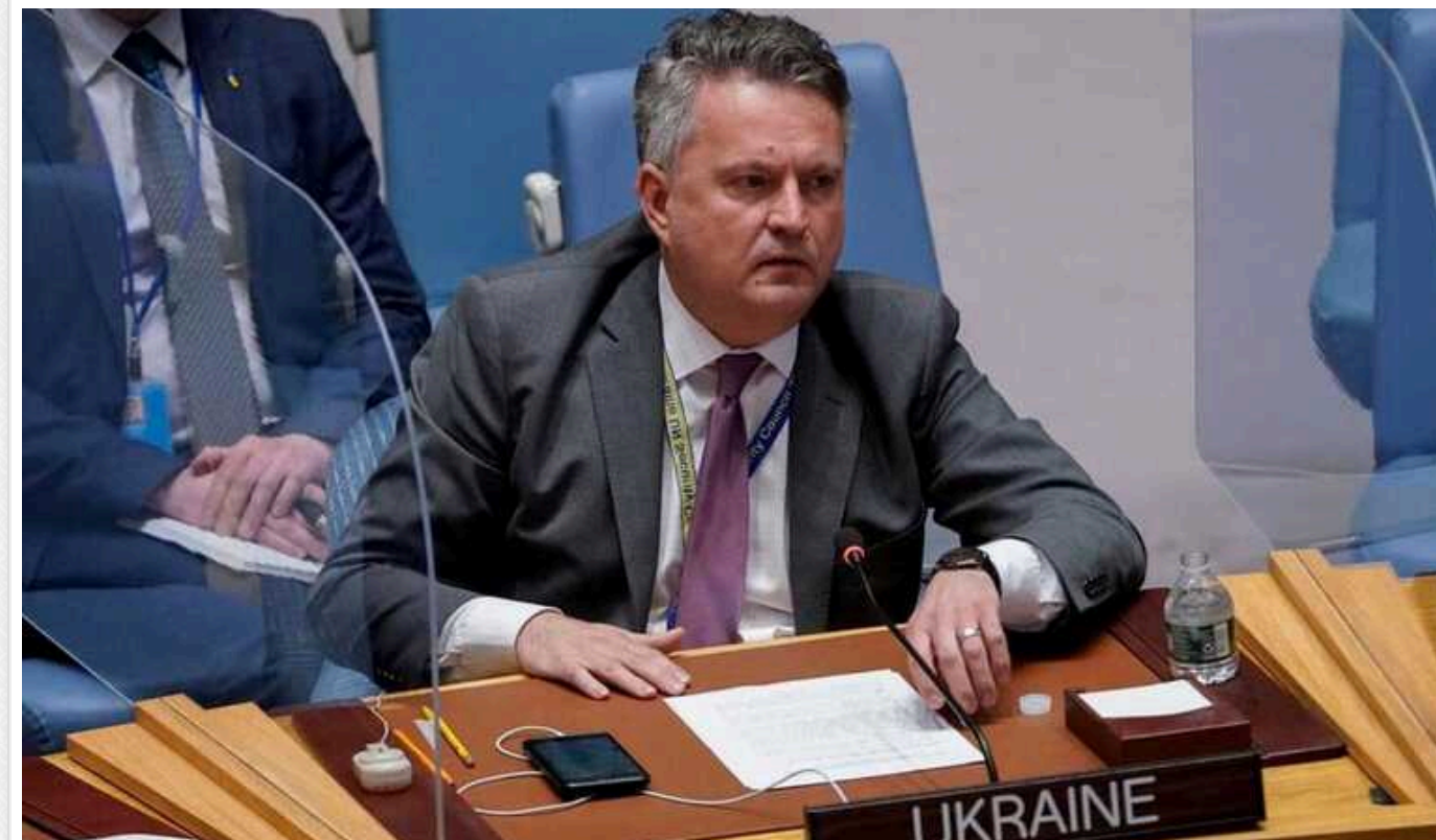
Україна на Раді Безпеки ООН закликала партнерів надати допомогу у знищенні російських ракет

Постійний представник України при Організації Об'єднаних Націй Сергій Кислиця звернувся до членів Радбезу ООН та усіх партнерів з проханням допомоги нашої країні відбивати атаки РФ. Вони могли б перехоплювати російські ракети, коли ті наближаються до їхньої території.