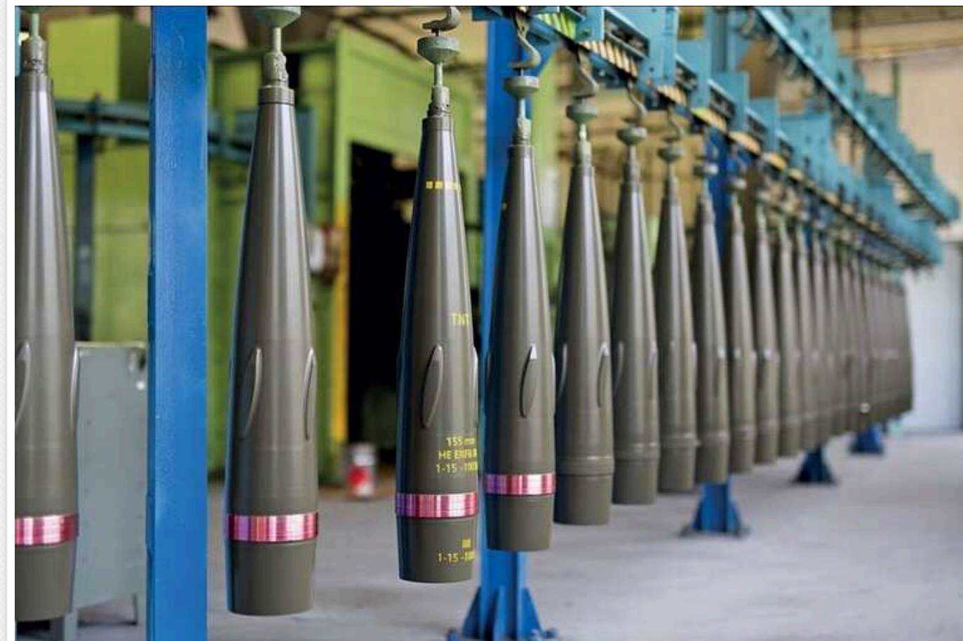
AP: В США завод у Пенсильванії вдвічі збільшив виробництво 155-мм снарядів для потреб України

Завод, що займається виробництвом боєприпасів в американському штаті Пенсильванія, який виготовляє основні артилерійські снаряди для України, зміг збільшити обсяги виробництва на 50%. Окрім цього, підприємство планує запуск нових потужностей.