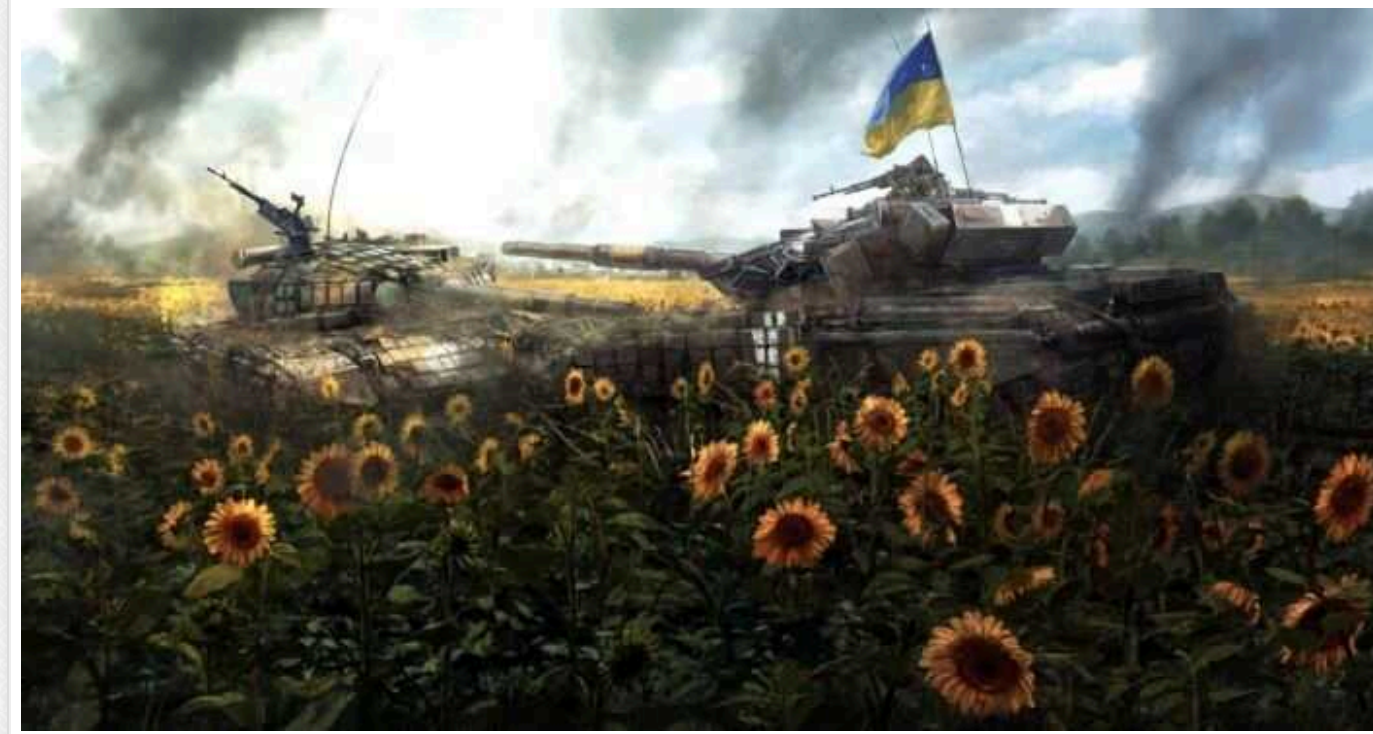
День пам'яті загиблих захисників України: трагічна історія і чому символом став саме соняшник

Унаслідок збройного нападу Росії, який триває з 2014 року, Україна щодня втрачає своїх захисників і захисниць. Належне вшанування їхньої пам'яті стало важливою справою держави та кожного з громадян.