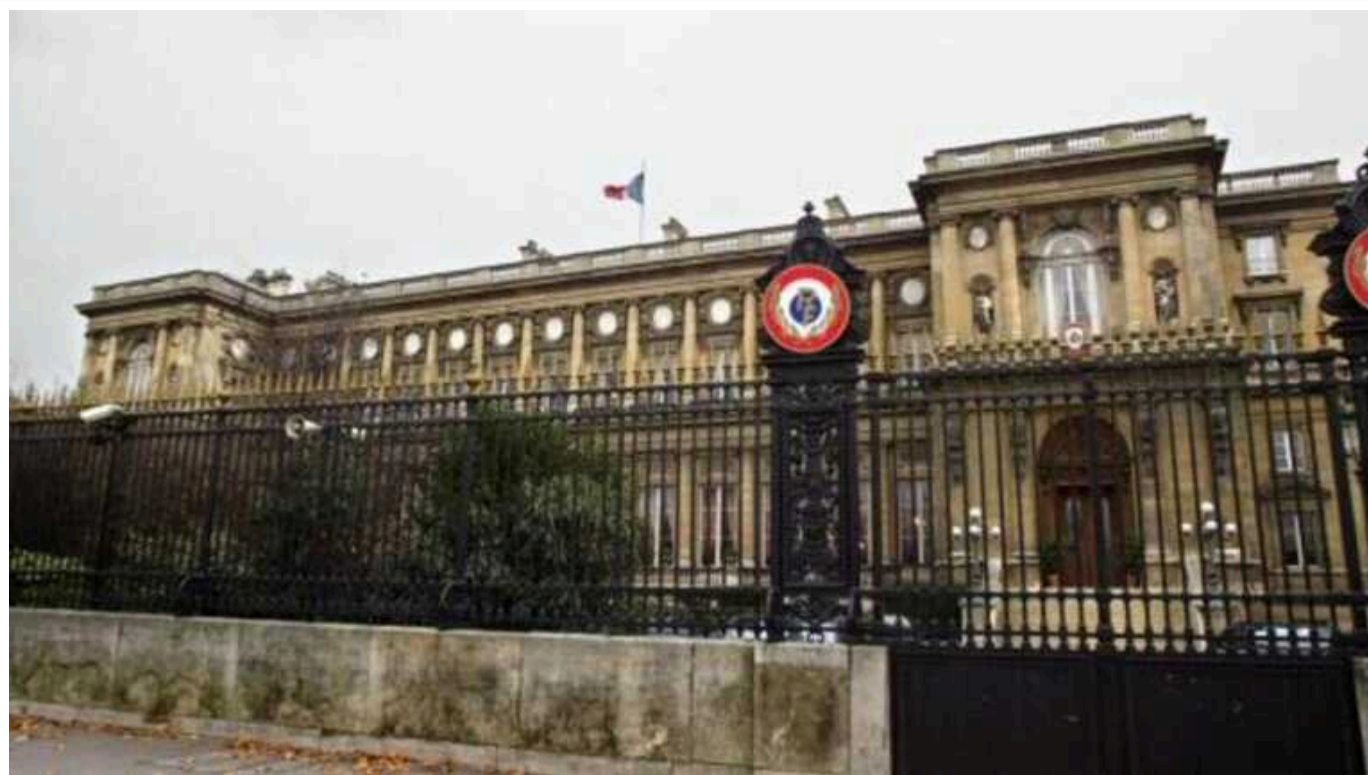
У французькому МЗС виникли претензії до процедури отримання Павлом Дуровим громадянства Франції, – ЗМІ