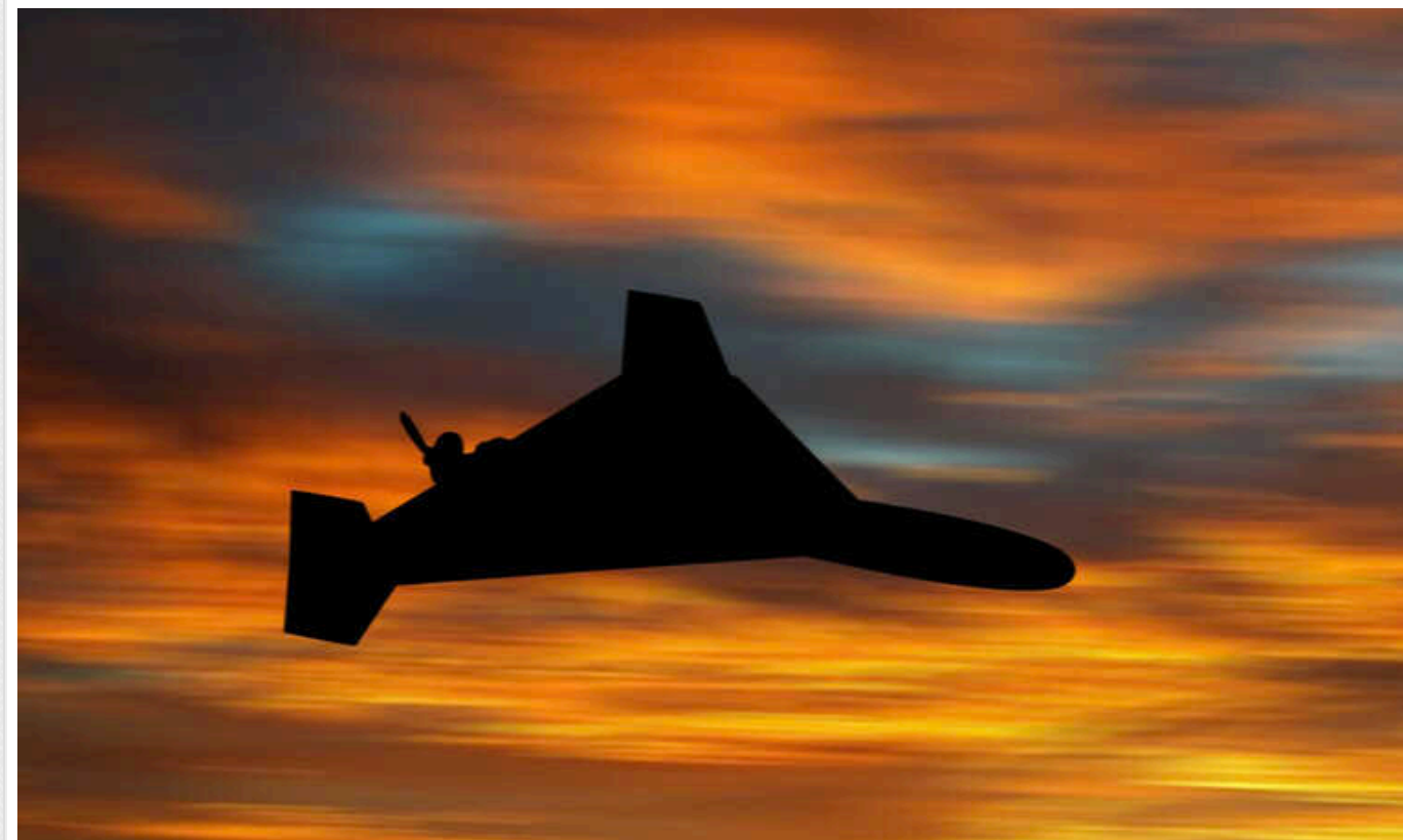
В українському небі зафіксовано понад 50 «шахедів», які запустили окупанти

Понад 50 «шахедів» зафіксовано у небі над Україною, однак росіяни продовжують запускати нові партії.