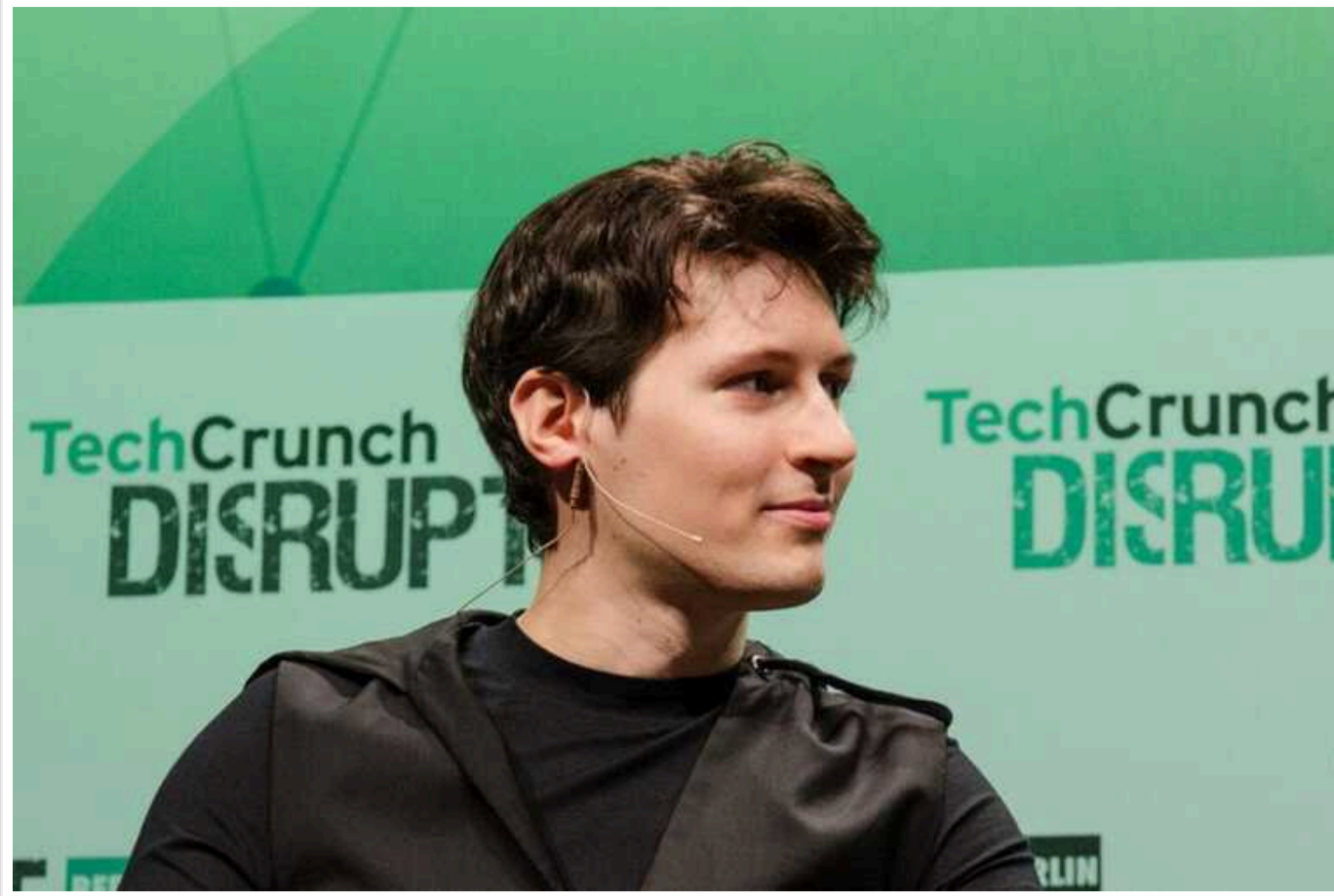
Дуров, перебуваючи на волі, не може виїхати з Франції та повинен відмічатися двічі на тиждень