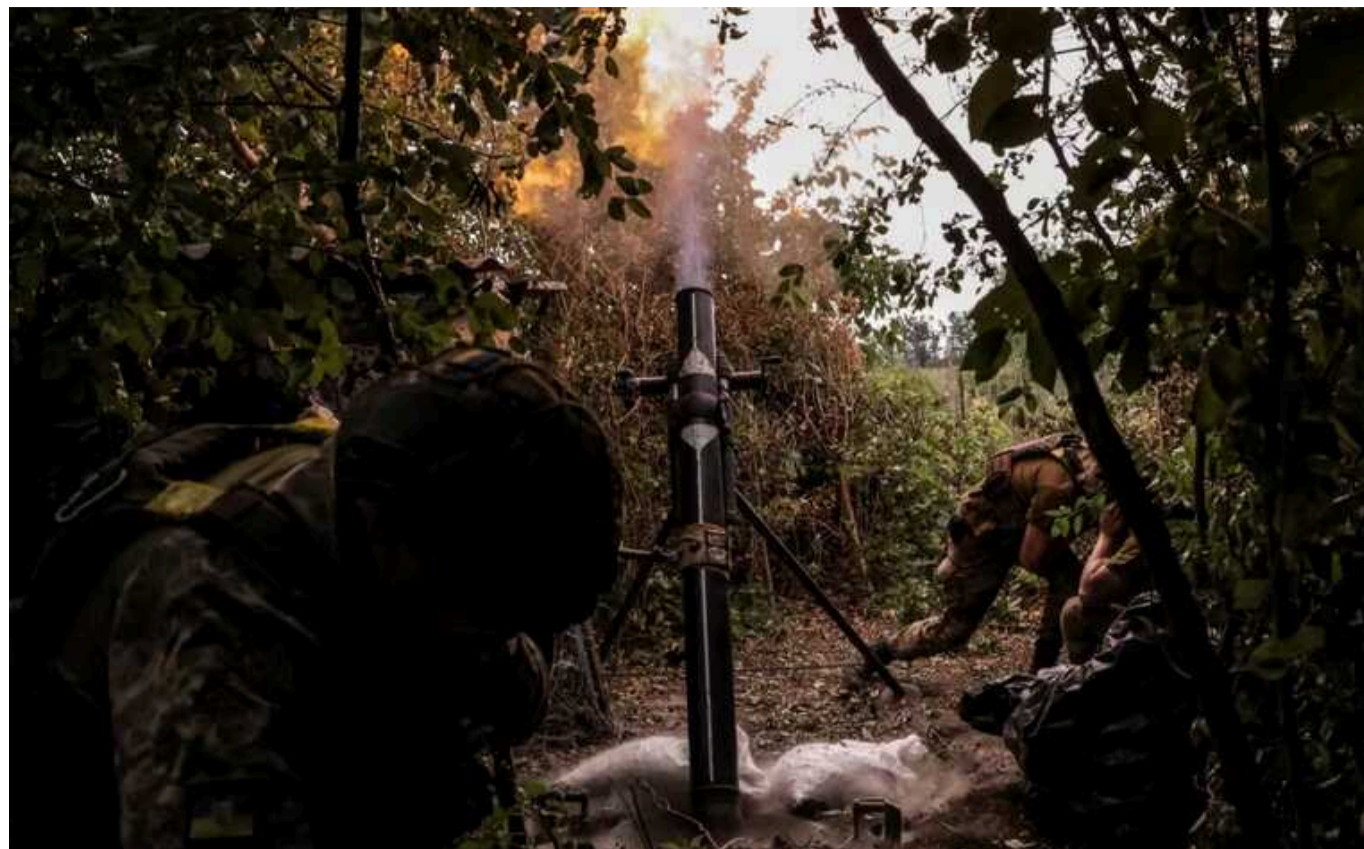
Ситуація на фронті: Окупанти активно наступають на чотирьох напрямках на Донеччині

Від початку доби, 28 серпня, на фронті сталося 182 бойових зіткнення. Протягом дня загарбники активно атакували на Покровському, Куп'янському, Курахівському та Торецькому напрямках.