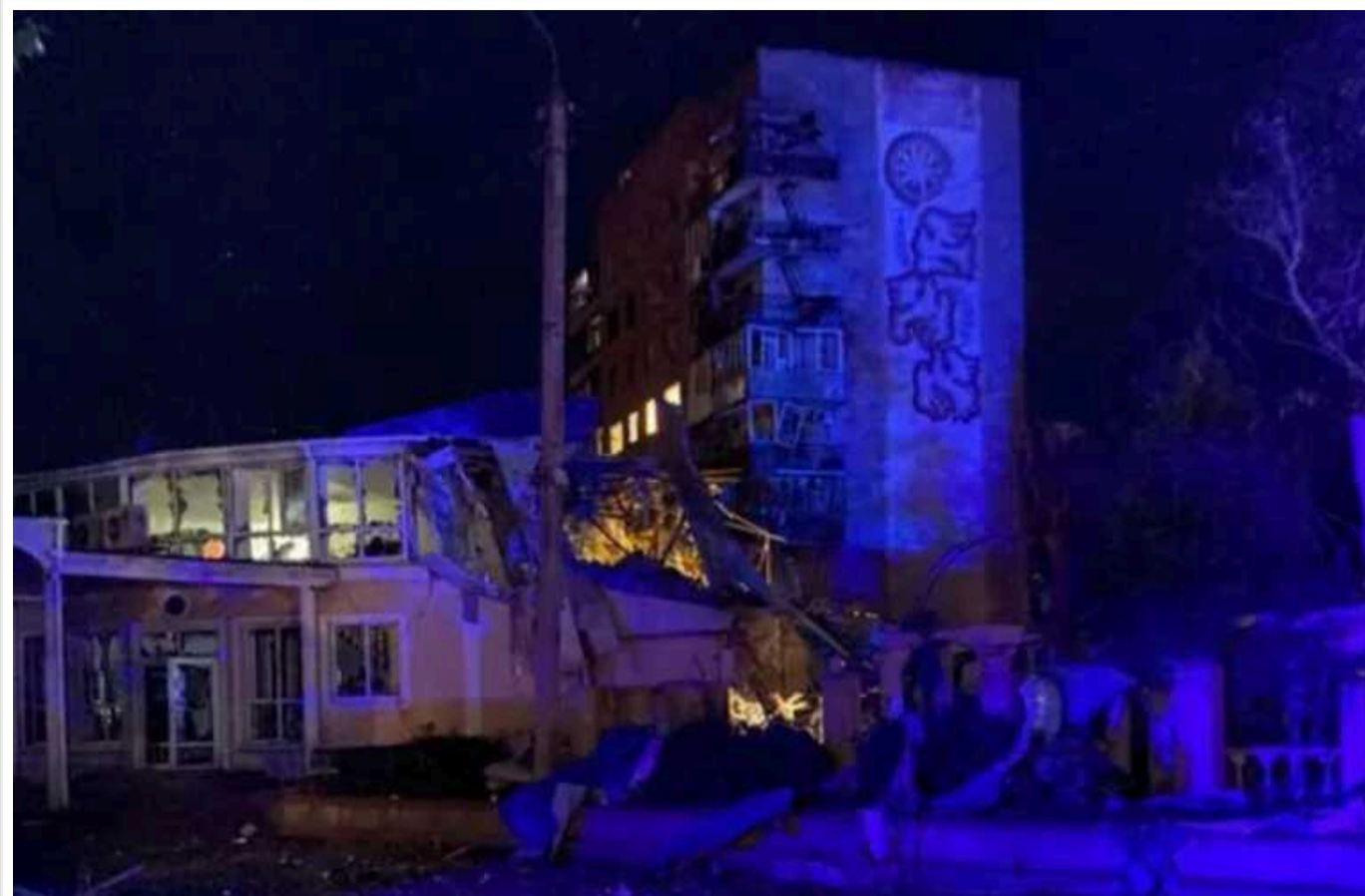
"Репортери без кордонів" засудили ракетний удар РФ по готелю у Краматорську, де загинув співробітник Reuters

Міжнародна організація зі захисту прав людини "Репортери без кордонів" засудила вбивство російськими окупантами співробітника Reuters Раяна Еванса.