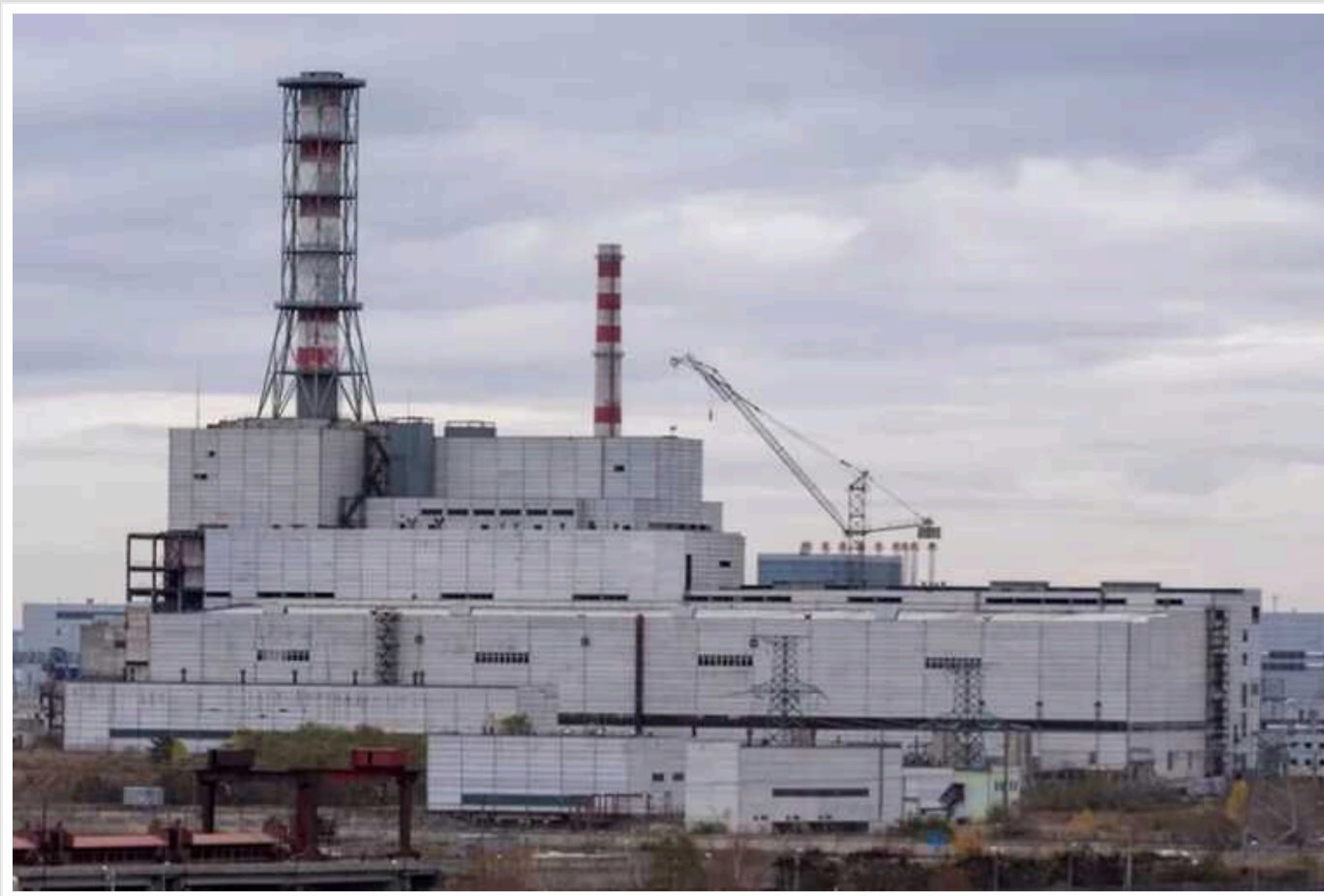
ISW: РФ намагалася використати главу МАГАТЕ, щоб представити Україну загрозою Курській АЕС

Представники Росії намагалися використати візит генерального директора Міжнародного агентства з атомної енергії (МАГАТЕ) Рафаеля Гроссі на Курську атомну електростанцію (КАЕС) для того, щоб неправдиво зобразити Україну як загрозу радіаційного інциденту, який, на думку російської сторони, підриває підтримку України з боку Заходу.